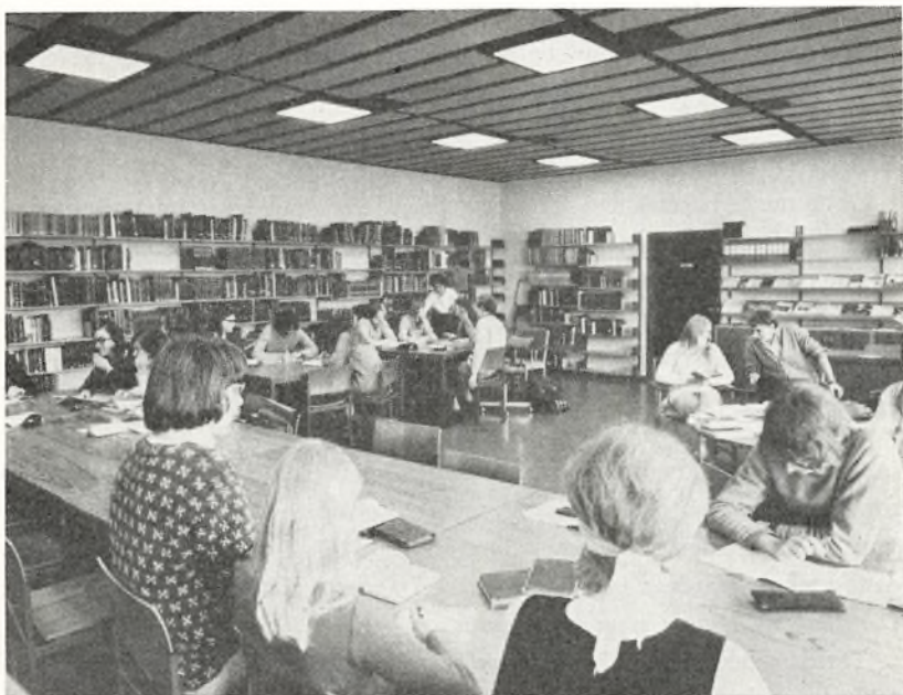
Biblioteket under et gruppearbejde i dansk. En væsentlig del af biblioteket, bl. a. de meget omfangsrige samlinger af ældre litteratur, er anbragt i et bogmagasin i kælderens med adgang ad en spindeltrappe fra bibliotekarens kontor.