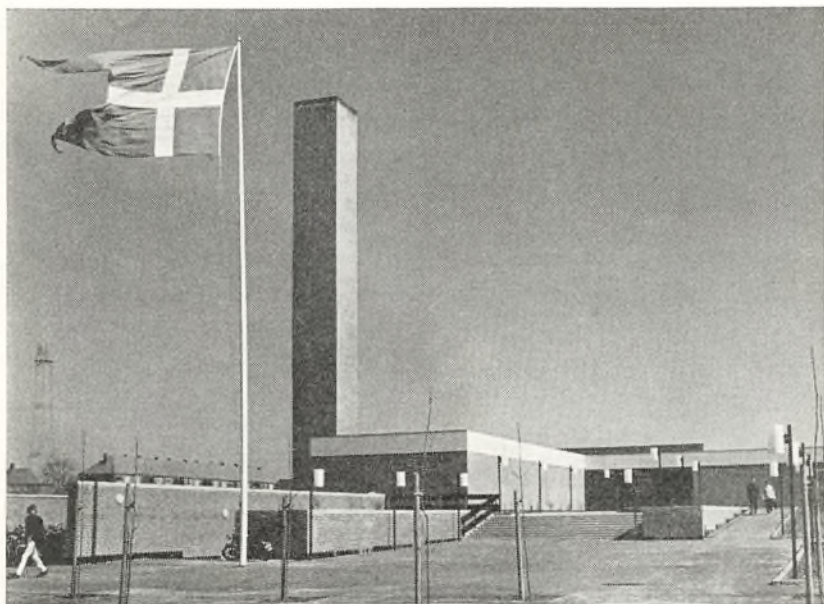
Roskilde Katedralskole, hovedindgangen.