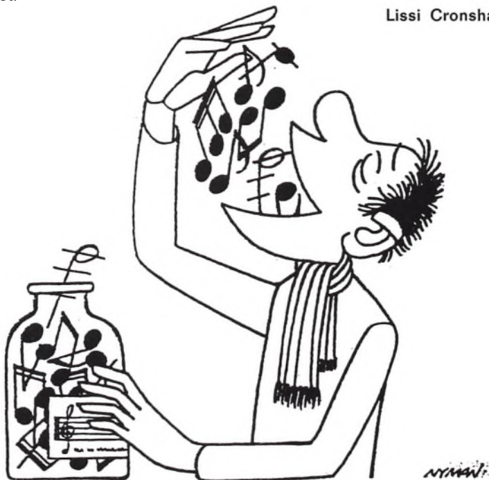
Tegning: Peder Nyman