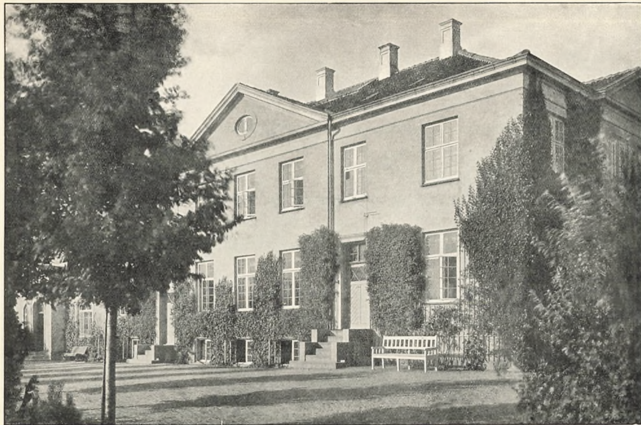
BESTYRER- OG ELEVBOLOG