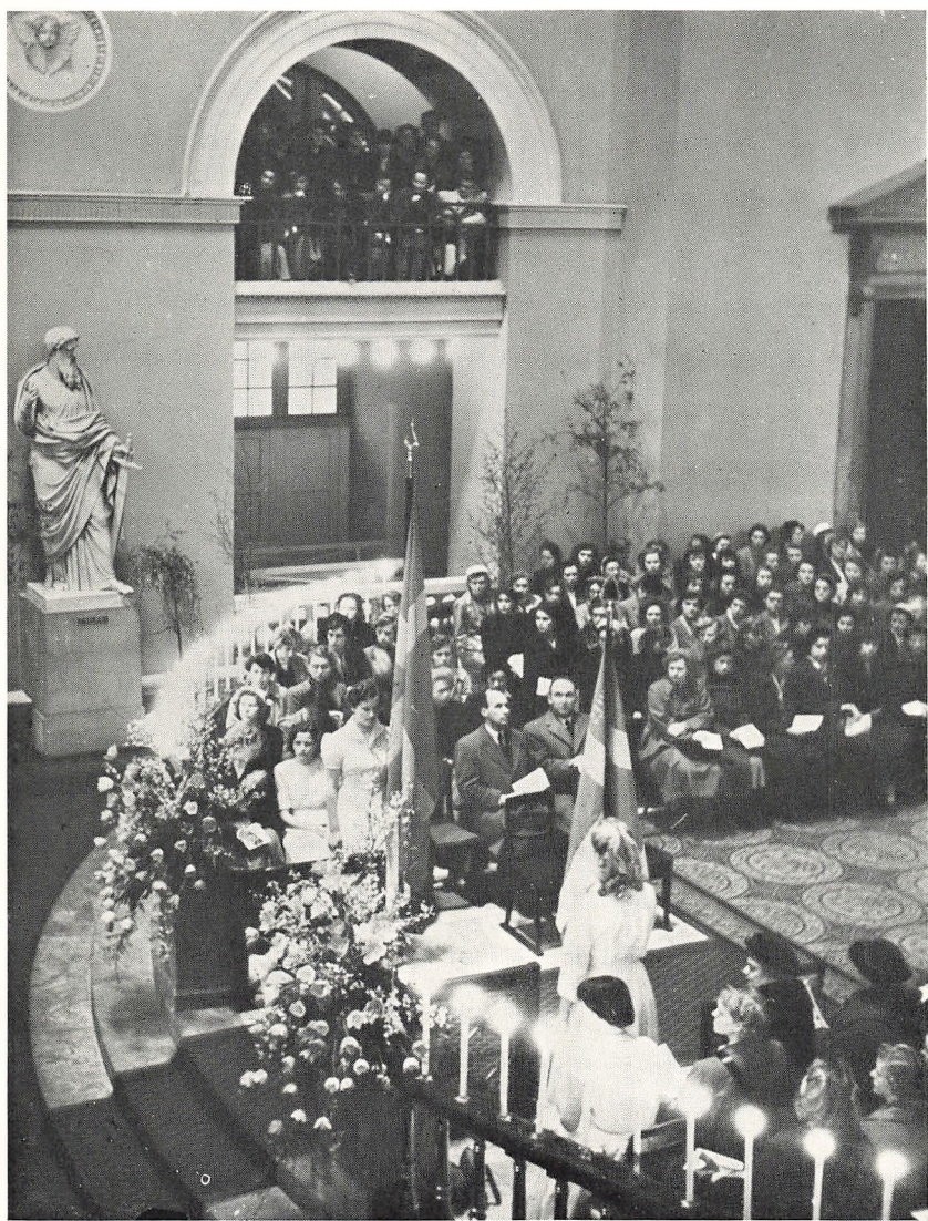
Fanevagt under morgensangen i Domkirken 1. maj.