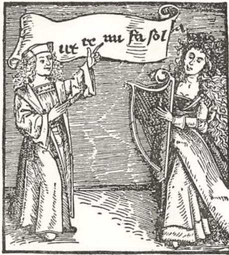
Undervisning i Solmisation