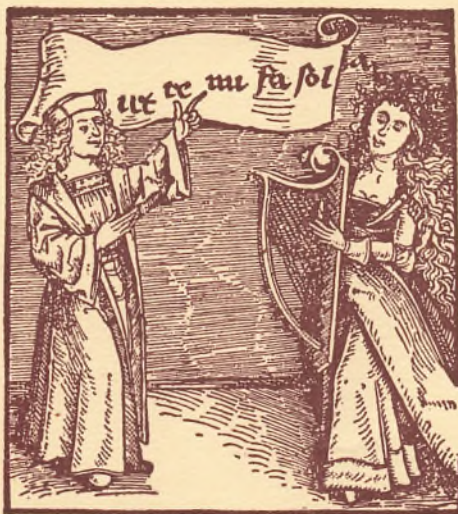
Undervisning i Solmisation Træsnit fra 1501

FESTSKRIFT I ANLEDNING AF MUSIKPÆDAGOGISK FORENINGS 50 AARS JUBILÆUM