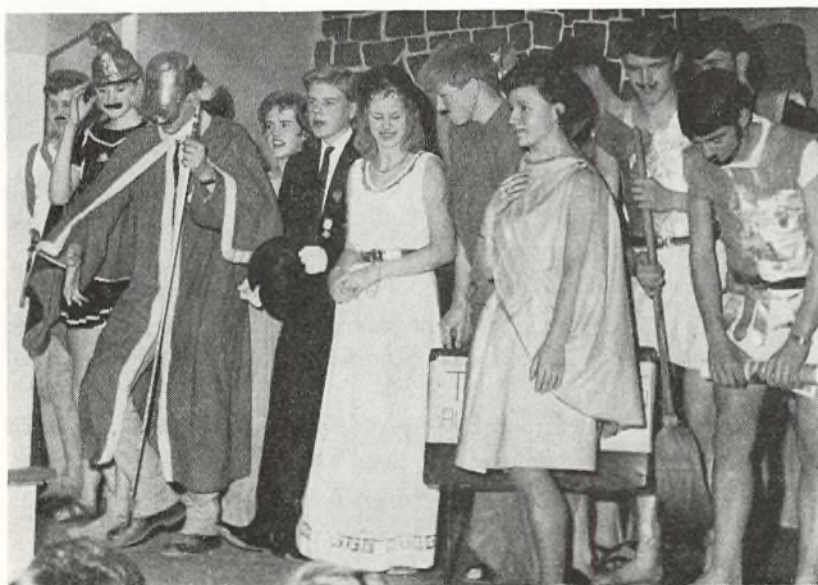
Fra »Olysses von Ithacia« den 2. marts 1963