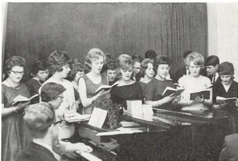
Gymnasiekoret ved årsfesten den 2. marts 1963