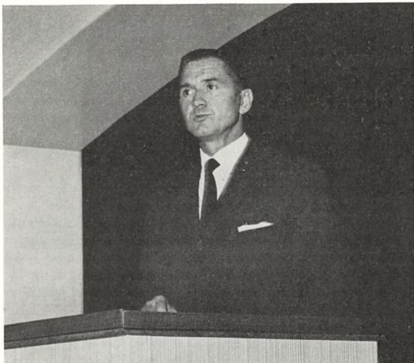
Borgmester Sund holder velkomsttale den 14. august 1962

Af mange grunde har vi dog ment det hensigtsmæssigt at begynde gymnasieundervisningen allerede nu, og dette synspunkt er man i undervisningsministeriet gået fuldt og helt ind for, ligesom det også er blevet bifaldet af vore 2 nabo-gymnasier i Roskilde og Haslev.