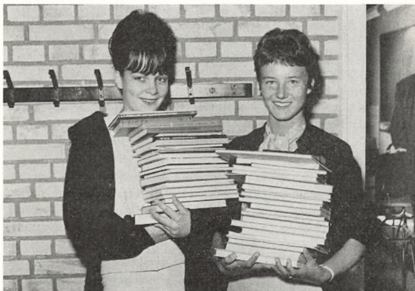
Bøger uddeles på den første skoledag

Jeg nærer ingen tvivl om, at der vil herske et godt og fordrageligt forhold skolerne imellem, men jeg vil — navnlig for Søndre skoles skyld — håbe, at vor boligløse og husvilde periode vil blive så kortvarig som mulig, og jeg sender en venlig tanke til de folk, der ude ved Ringstedvejen arbejder på at rejse den nye bygning, og jeg ønsker fremgang og arbejdsglæde, også når sure efterårsdage og en kold vinter truer med at forstyrre rytmen i det daglige arbejde.