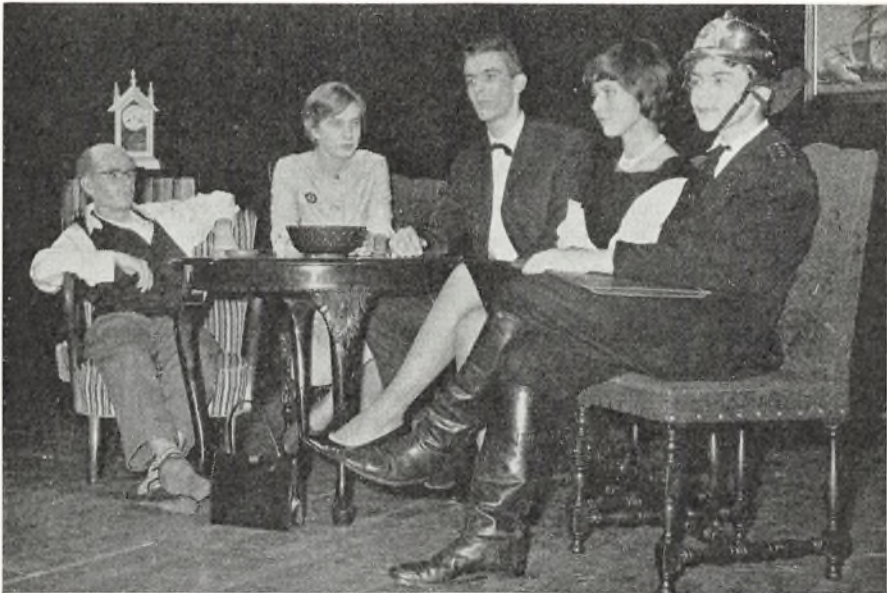
Scene fra skolekomedien: Elever fra II G i Ionesco's „Den skallede sargerinde“.