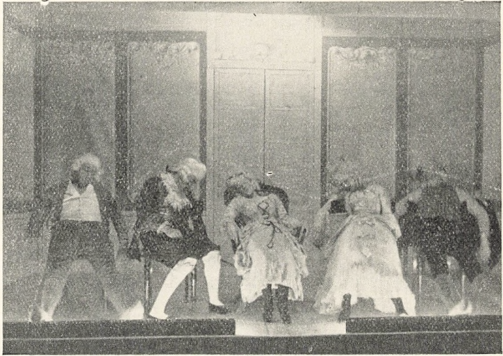
Slutningsoptrinet af „Kierlighed uden Strømper“, Novbr. 1922. Alle Stykkets Personer har „stukket sig“!

Endvidere blev det bestemt, at Overskudet af Entréindtægterne skulde anvendes til velgørende Formaal indenfor Skolen. Først skulde naturligvis de store Udgifter til Teatrets Tilvejebringelse dækkes, men derefter blev de overskydende Penge anvendt til mange, gode og nyttige Ting. Her skal blot nævnes, at den Skolefane, der vajer ved alle vore Festligheder, er anskaffet for de første Penge, der blev indtjent ved Skolekomedien.