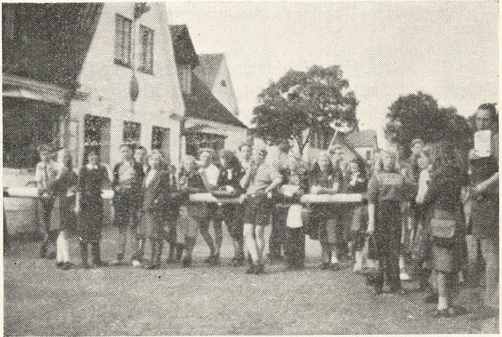
Elever ved Krusaa-Grønsen.

I Dagene fra 24.—30. September 1946 gennemførtes en Lejrskole med Eleverne fra samtlige Gymnasielklasser. Turen gik til Kollund Grønhjem ved Flensborg Fjord, og Prisen var kun 30 Kr. pr. Elev, idet Kommunen afholdt yderligere Udgifter. Selve Rejsen foregik med Statsbanerne, men næsten alle Ekskursionerne gennemførtes paa Cykle.