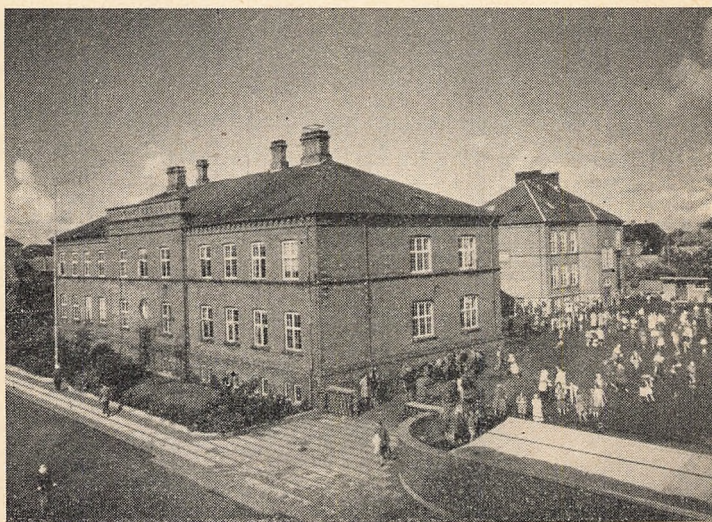
Gamle Grundskolebygning, opført 1886. I baggrunden Borgerskolebygningen, opført 1907.