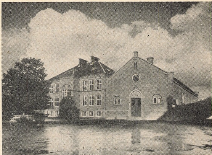
Mellemskolebygningen og den store gymnastiksal. begge opført 1908.