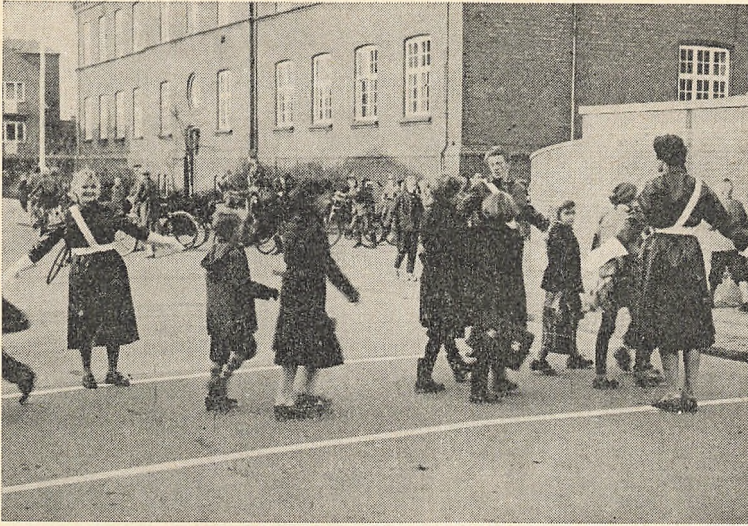
Skolepatrulje i virksomhed ved Danmarksgades skoler.

Færdselsundervisningen i skolerne blev i skoleåret aktualiseret med velvillig bistand fra politiet, idet nogle af byens politibetjente blev stillet til rådighed for skolerne dertil, og hver klasse fik en time i færdselslære.