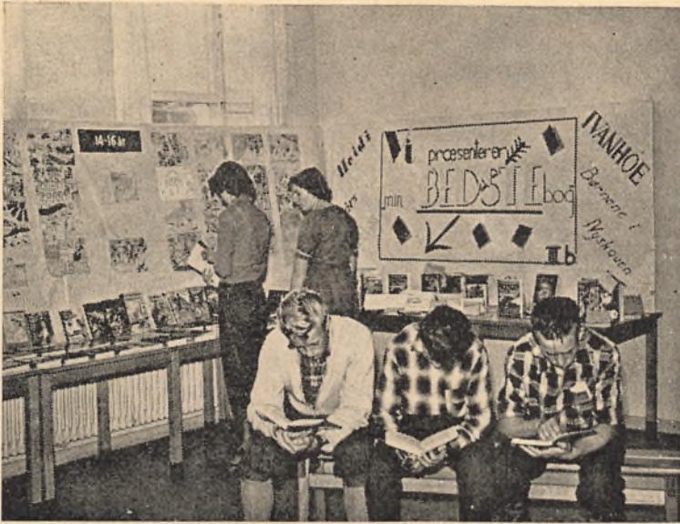
Udstilling på Sønderlandsskolen.