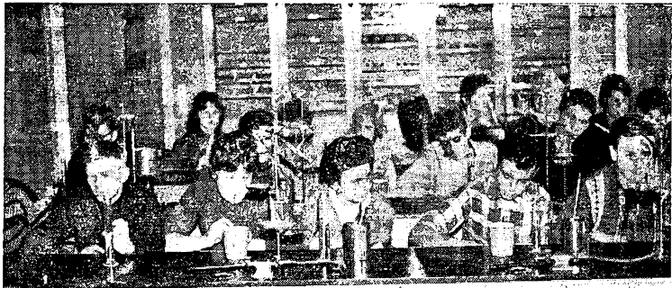
Fysiktime i Sønderlandsskolen.