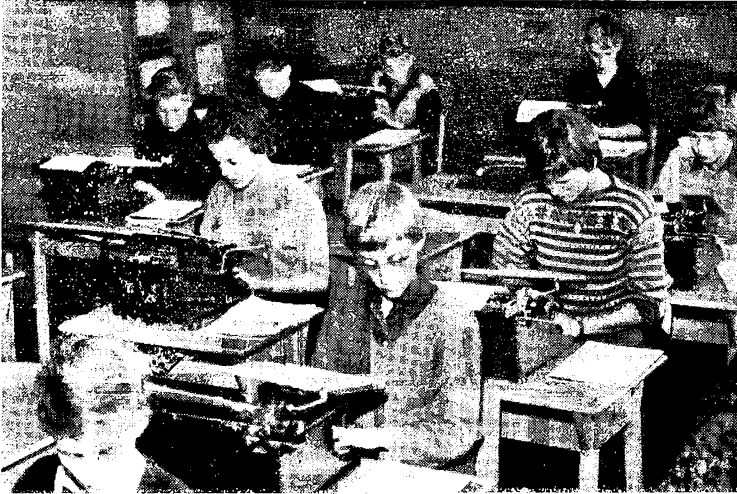
Et udsnit af 9. klasse, Danmarksgades skole. Time i maskinskrivning.