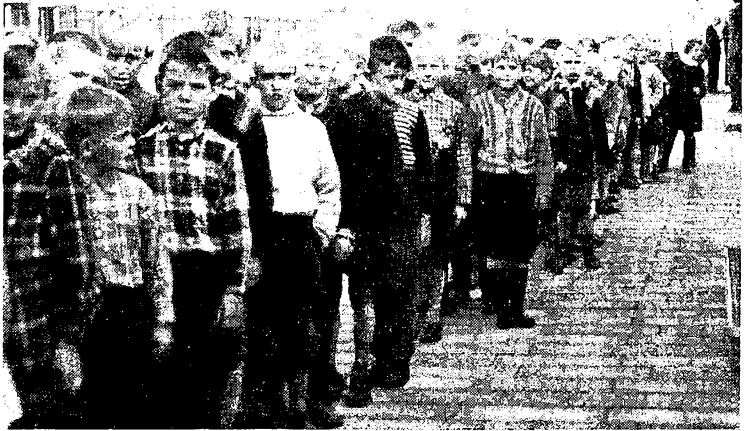
Eleverne stiller op i skolegården.