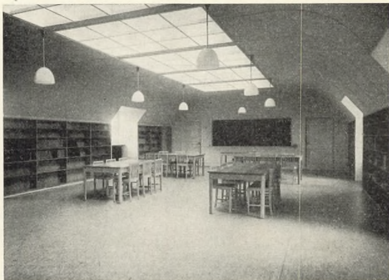
Læseværelse i Hobrovejens Skole.

Inventaret — saavel det løse som det faste — er udført