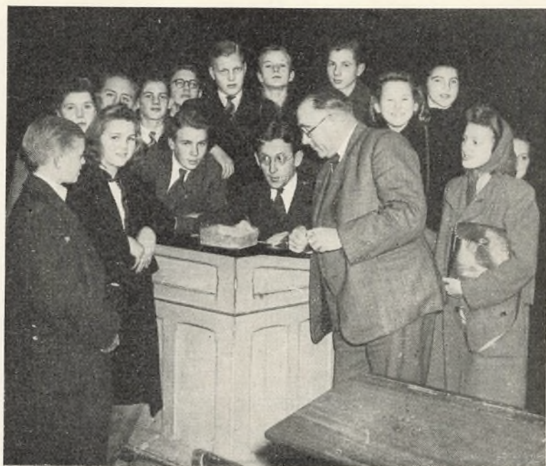
Indmeldelser i Ungdomsskolen.