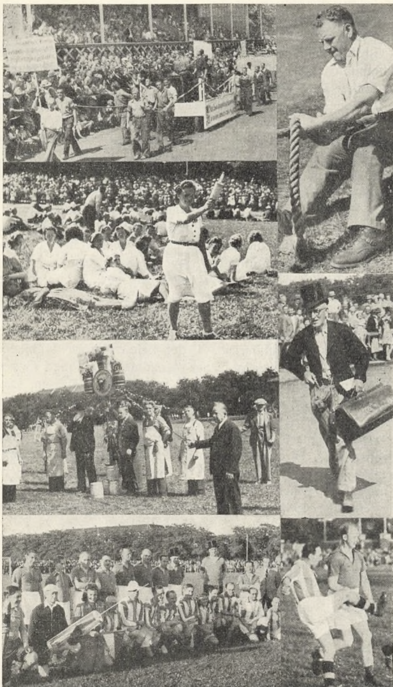
Fagenes Fest og „Fodboldkampen“ 1943.