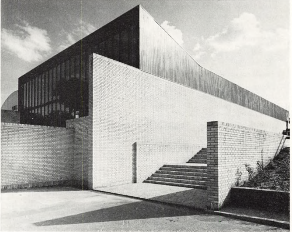
Eksteriør af svømmesalen på Østre Allé