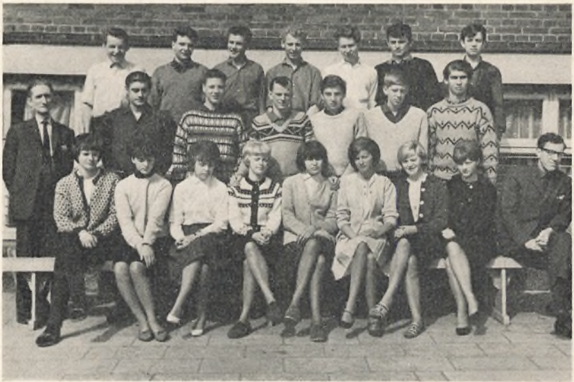
3 real D. 1964/65