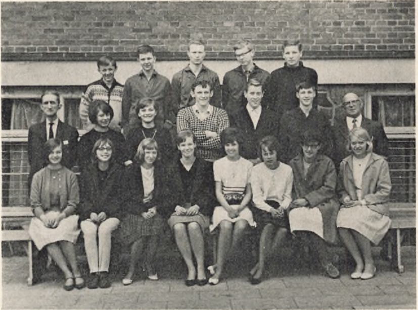
3 real B. 1964/65