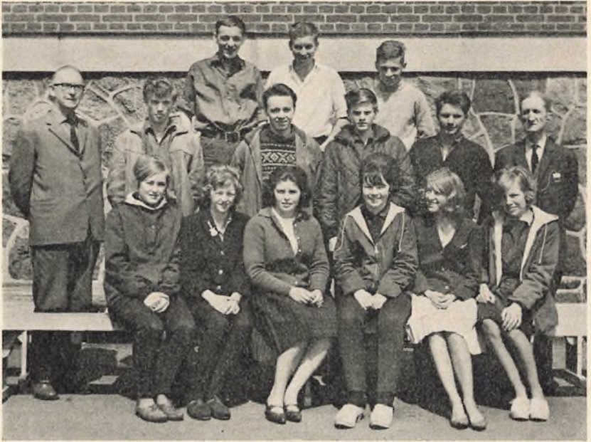
9 an. 1963/64