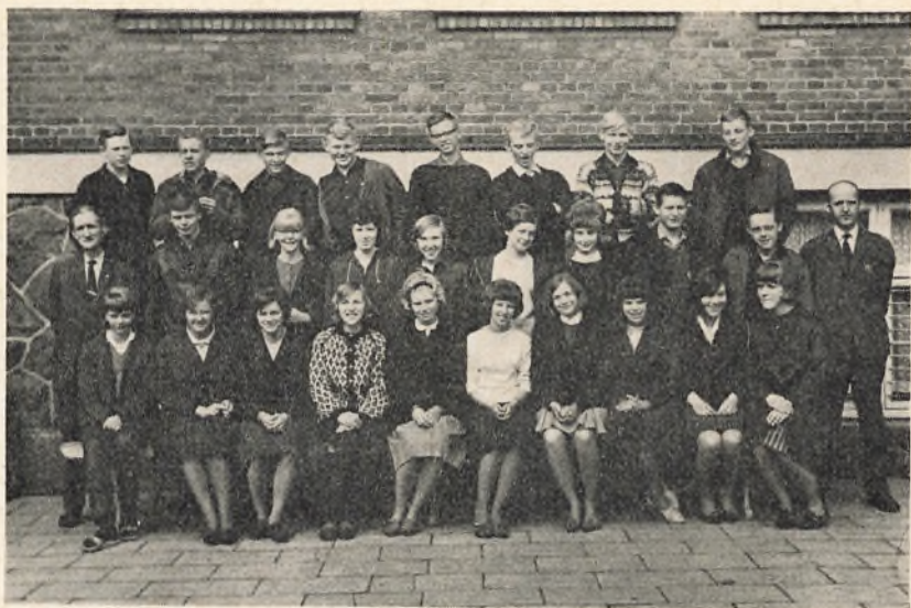
3 real A 1963/64