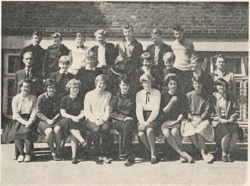
9 an. 1964/65