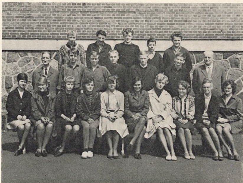
3. real D. 1963/64