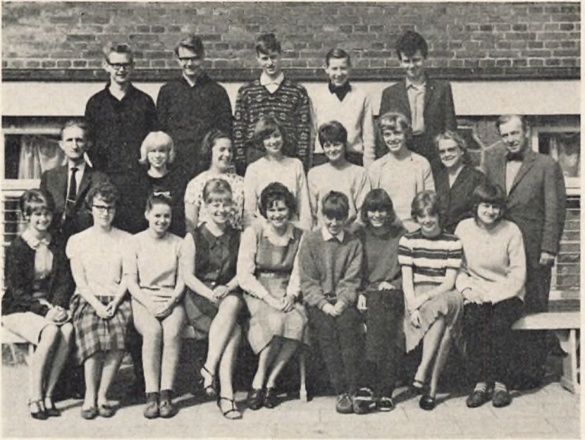
3 real A. 1964/65