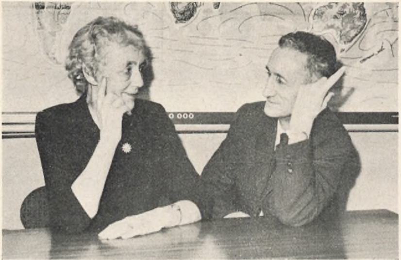
Lærer og elev 40 år senere.