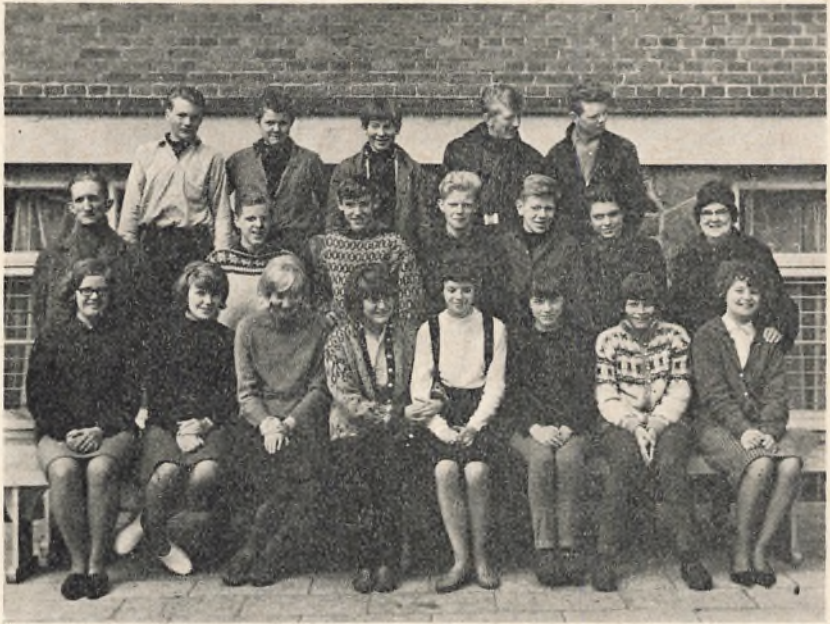
9 an. 1964/65