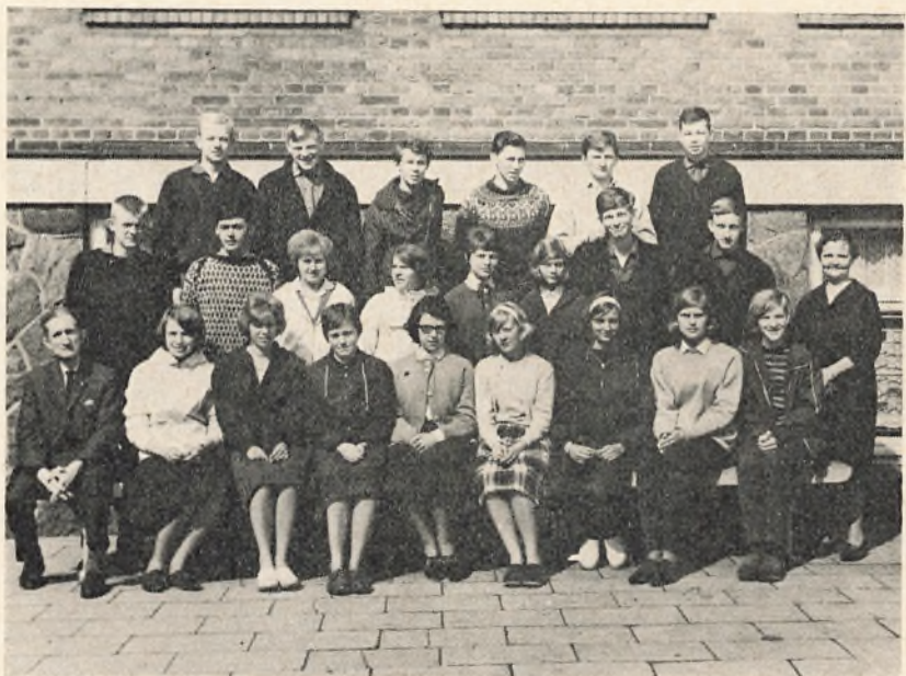
3 real B. 1963/64