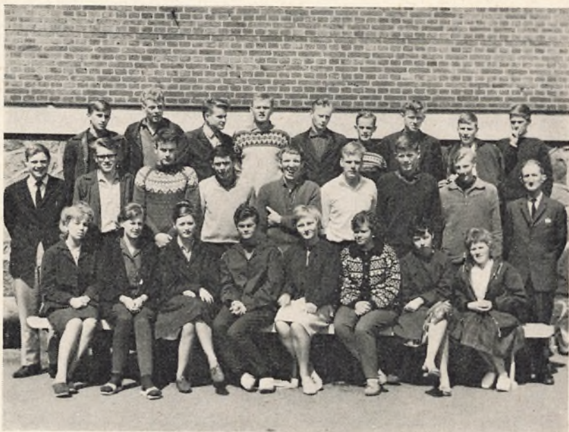
3 real C. 1963/64