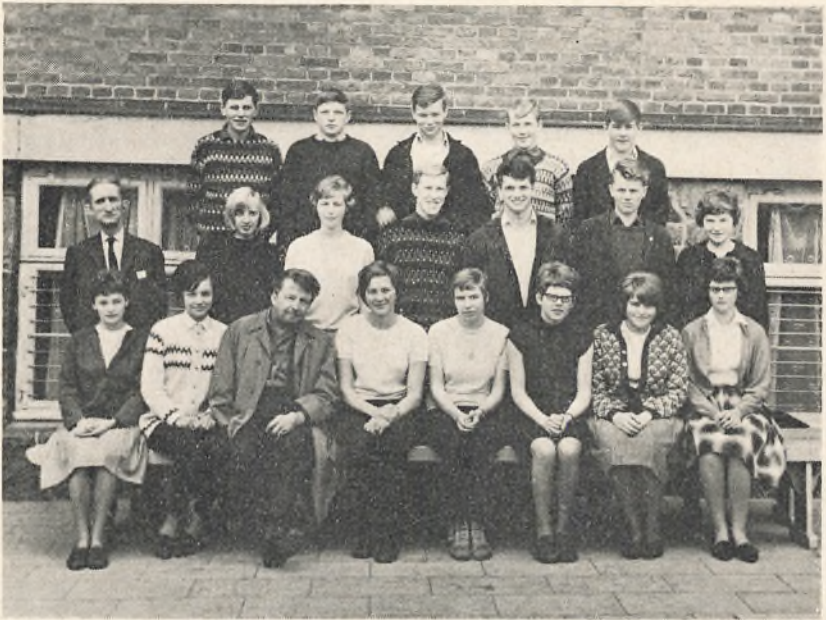
3 real C. 1964/65