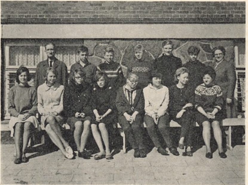
9 an. 1963/64