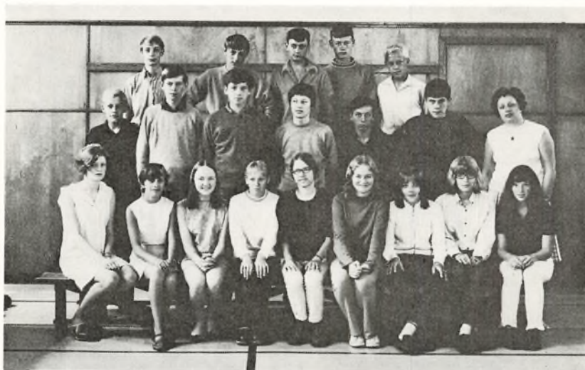
9. p. 1969