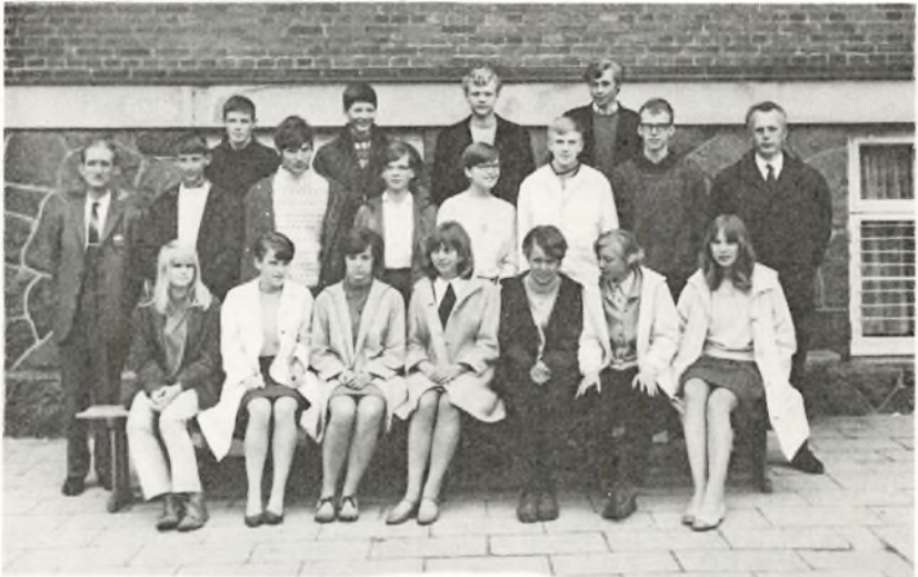
3. real B. 1968