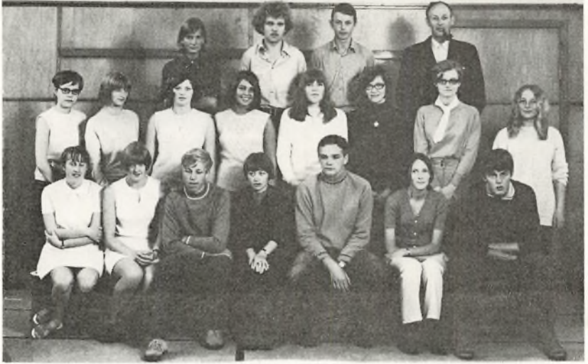
3. real D. 1969