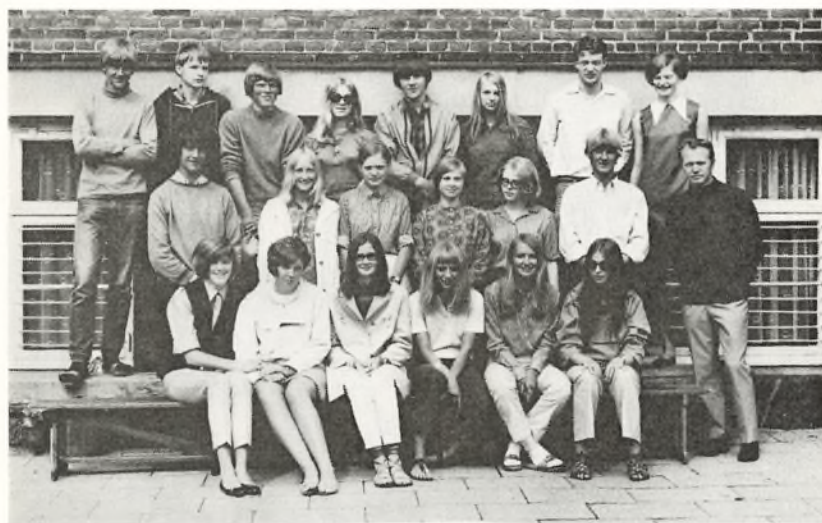
3. real A. 1969