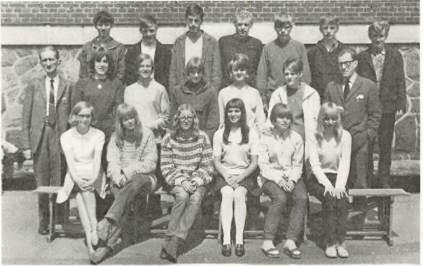
3. real C. 1968