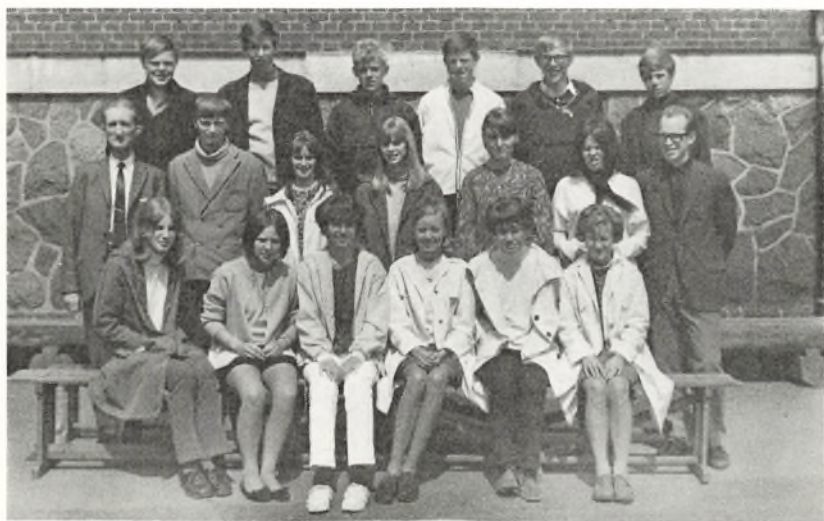
9. p. 1968