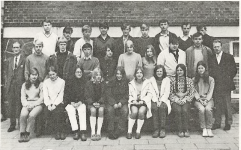
3. real D. 1968