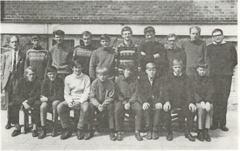
9. t. 1968