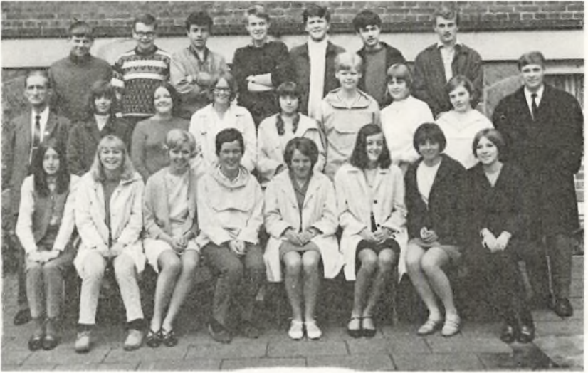
3. real A. 1968