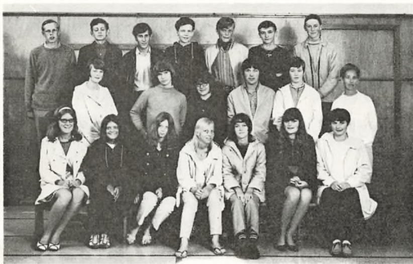
10. c. 1969