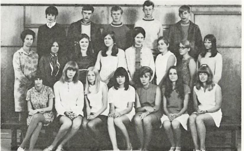
3. real C. 1969