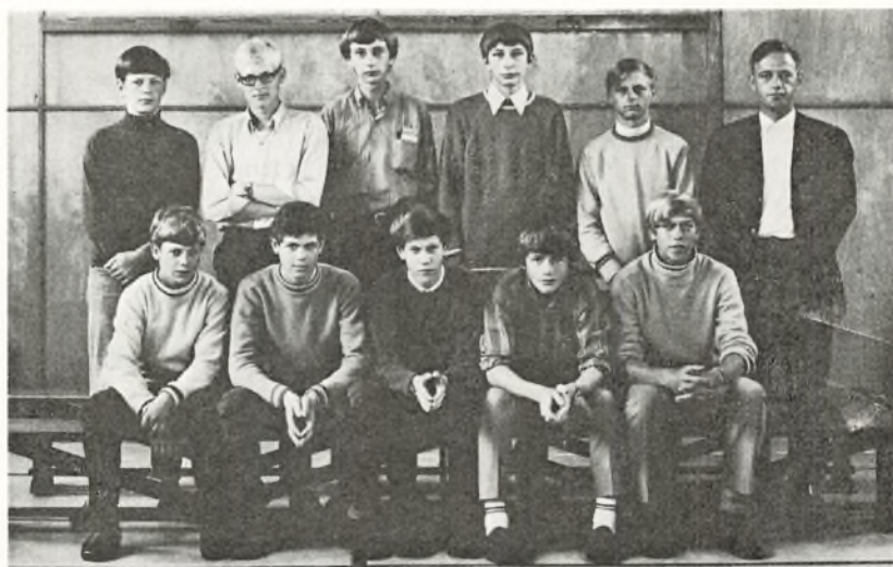
9. l. 1969