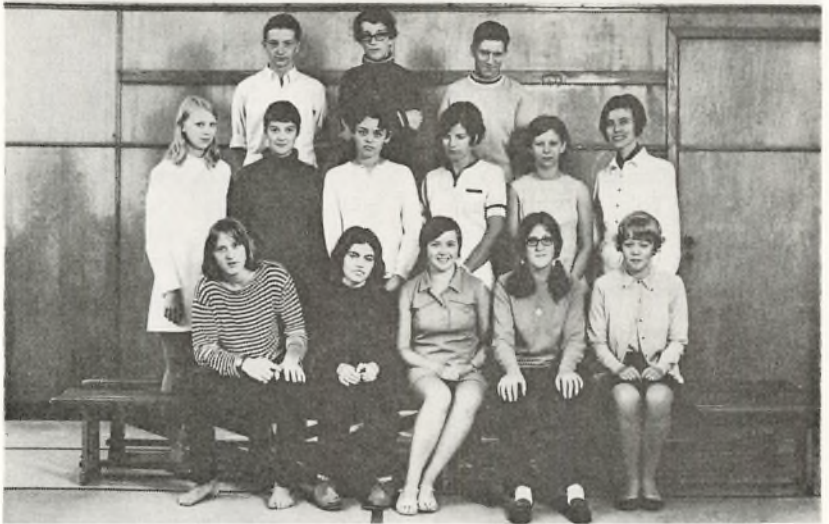
3. real E. 1969