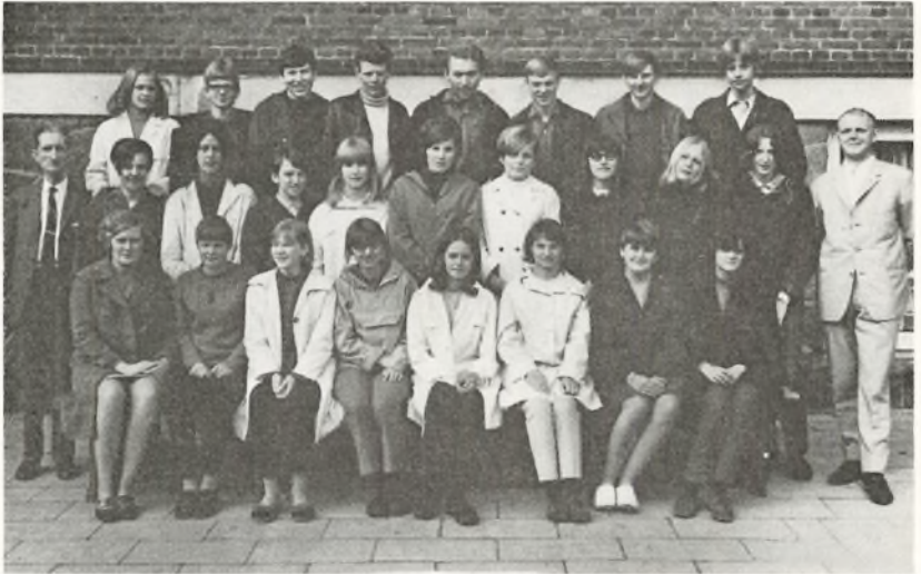
10. klasse 1968