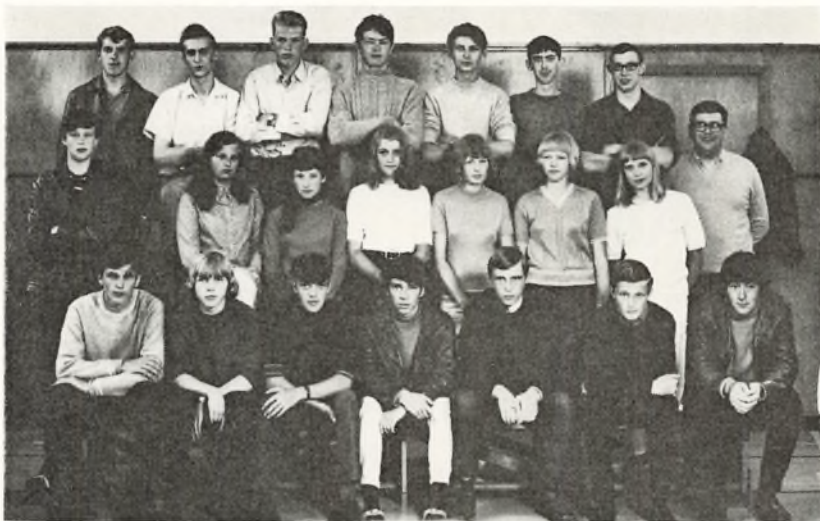
10. a. 1969