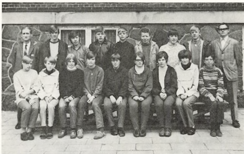
9. m. 1968