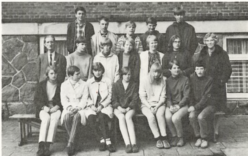
9. n. 1968