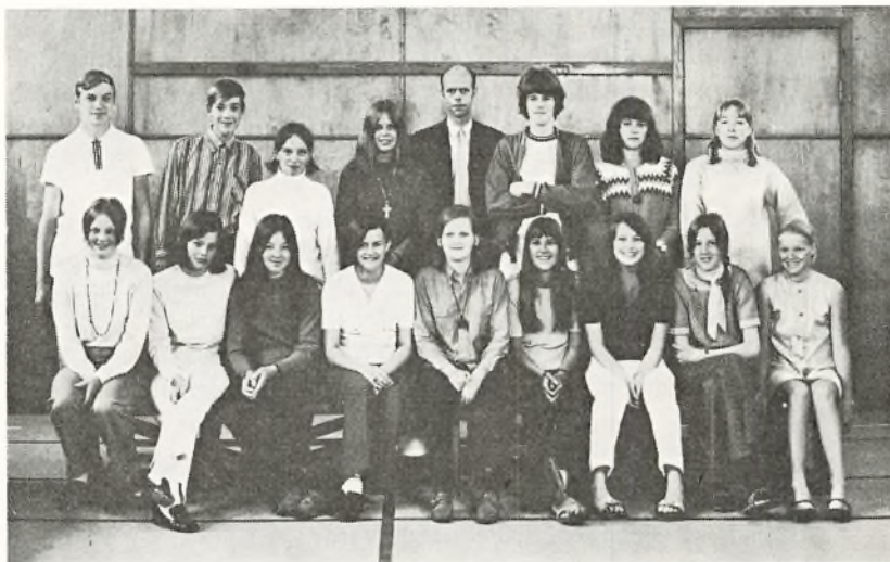
9. n. 1969