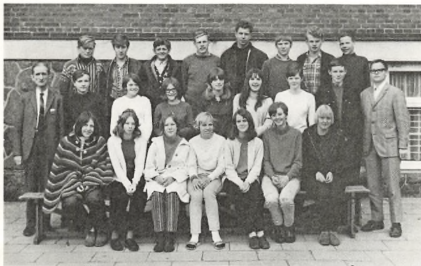
9. o. 1968