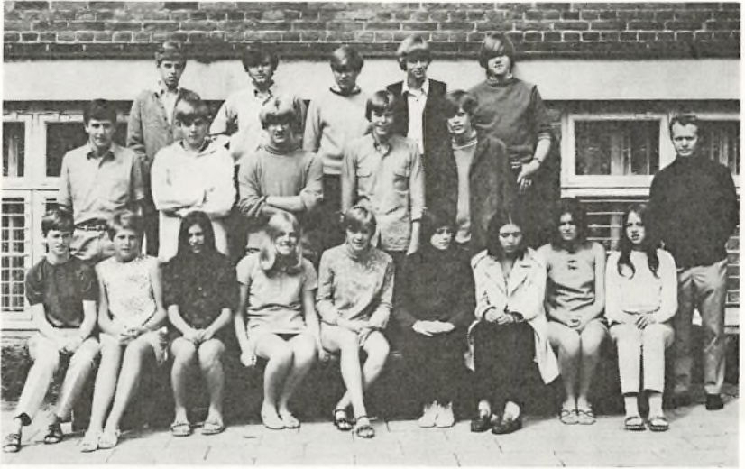
3. real B. 1969