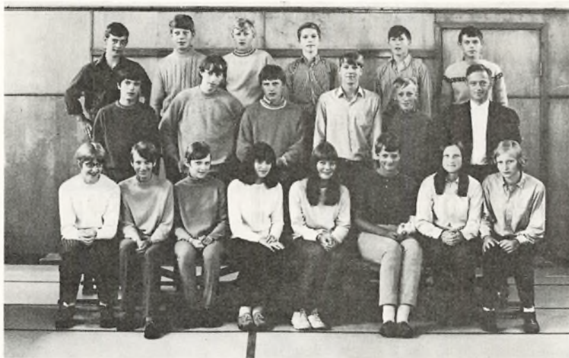
9. o. 1969