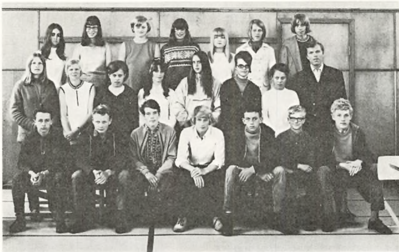
9. m. 1969