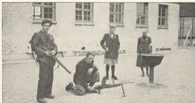
Frihedskæmperne indtager Skolen 5. Maj