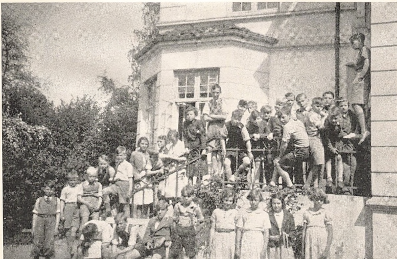
Et Udpluk af Flokken.

Naar jeg i Aar ikke har sendt Karakterbøger hjem, har det sine bestemte Grunde. Dels har jeg villet hindre Eleverne i at henfalde til et usundt „Karakterjageri“, hvor Glæden over de erhvervede Kundskaber druknede i et Virvar af ligegyldige Plus'er og Minus'er. Dels har jeg — og dette er den tungest vejende Aarsag! — villet befri de Børn, der gjorde deres bedste , men dog ikke naaede højt i Skalaen, for den „Mismodsfølelse“, der uvægerligt maa blive Resultatet — bevidst eller ubevidst — naar man hver fjortende Dag faar at vide paa Prent, at man „ikke kan“. Dette betyder naturligvis ikke , at Forældrene skal være uvidende om Børnenes Standpunkt! Kom og tal med mig! Ring op, og vi finder nok en Tid! Det er min Overbevisning, at en personlig Samtale er tusind Gange mere værd end et nok saa „nøjagtigt“ Tal i Karakterbogen! Spørgsmaalet er jo, naar det kommer til Stykket, ikke blot hvor langt Pigen eller Drengen er „nede“ i Tysk og Engelsk, men nok saa meget hvorfor det i Øjeblikket ikke rigtigt vil gaa! Mon ikke vi i Samtalens Løb ved fælles Hjælp kunde finde Aarsagen frem og — komme Maalet et Skridt nærmere! G. J.