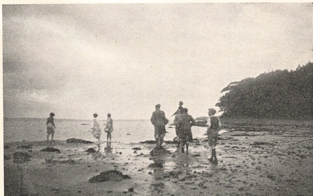
Fra Udflugten til „Dejligheden“.