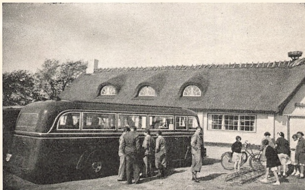
Ved Færgetroen „Bi-lidt“.

25. Maj: Fornarsskovturen . — I de vante Biler gik Turen denne Gang mod Nord-Vest. Efter at have aflagt Besøg i Roskilde Domkirke, kørte vi til „Dejligheden“. „Koldt“ Frokostbord! Via Bramsnæs-Vig til Jægerspris, hvor vi „gik Ture“ og „legede Røver og Soldater“. — Chokoladegilde paa Hjemvejen i den skøne Færgetro „Bi-lidt“.