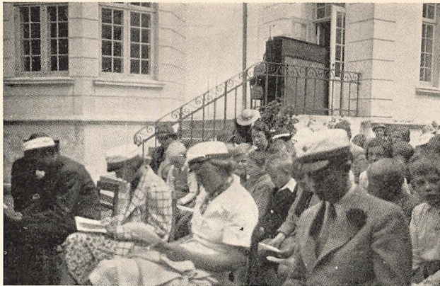
Fra Aarsafslutningen 1937.