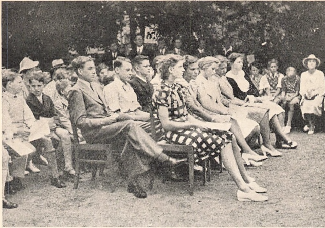
Fra Aarsafslutningen 1938.