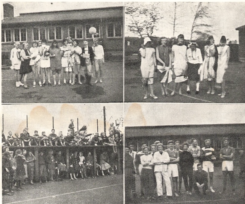
Fra realisternes sidste skoledag