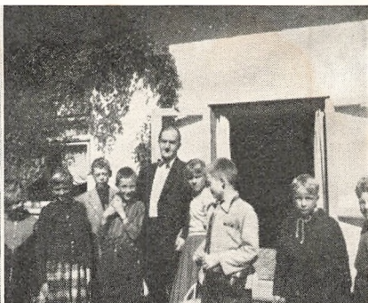
Fra årets skovture