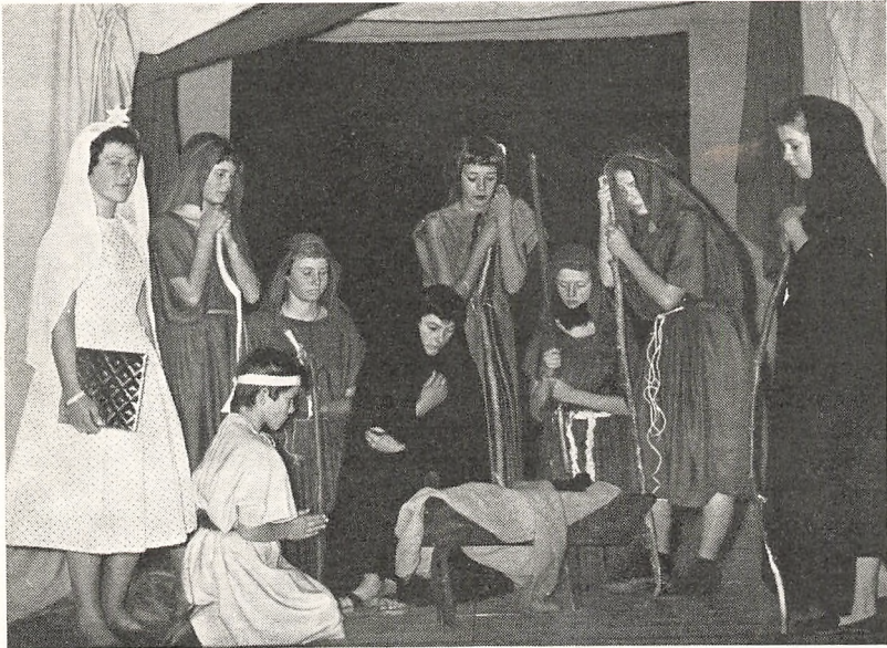
III mellem A opfører hyrdespil