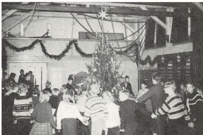
Fra juleafslutningen for de yngre klasser