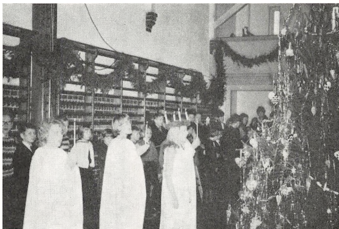
Sancta Lucia ...