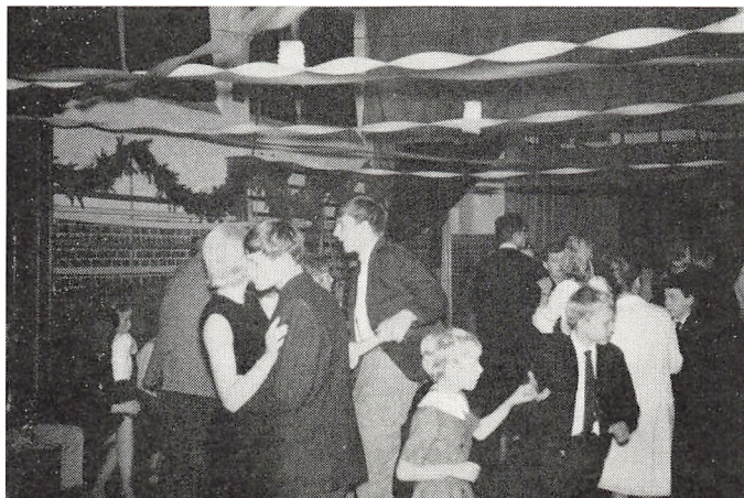
Store og små i dansen ved juleballet

27. november afholdtes forældrekræds møde.