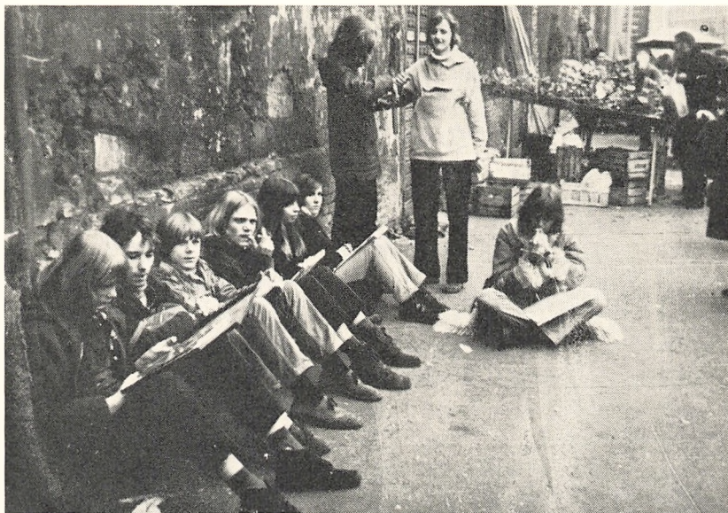
Der hviles ud efter indkøbene på Pzza Vittorio Emanuele

teret, inden vi tager bussen til Peterskirken for at modtage Pavens velsignelse. – Ih, hvor det hjalp.