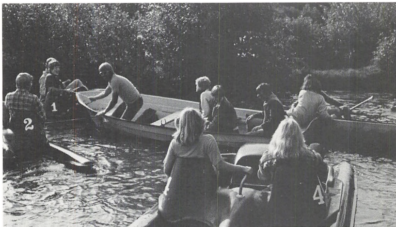
Myldretid på Brande sø