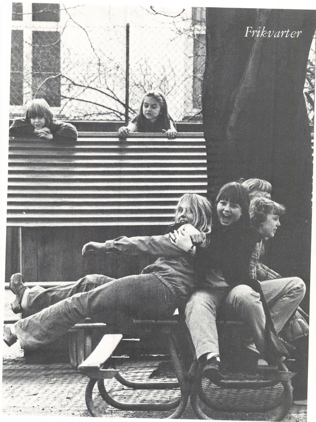
Billederne på omslaget, samt siderne 2, 3, 10, 16 og 17, er optaget af lærer Steen Duelund, på Gunnar Jørgensens Skole i indøværende skoleår. Årsskriftet er redigeret af Grethe Sevaldsen og Paul Christiansen.