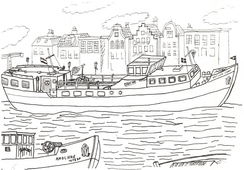
»Antilope« af Utrecht