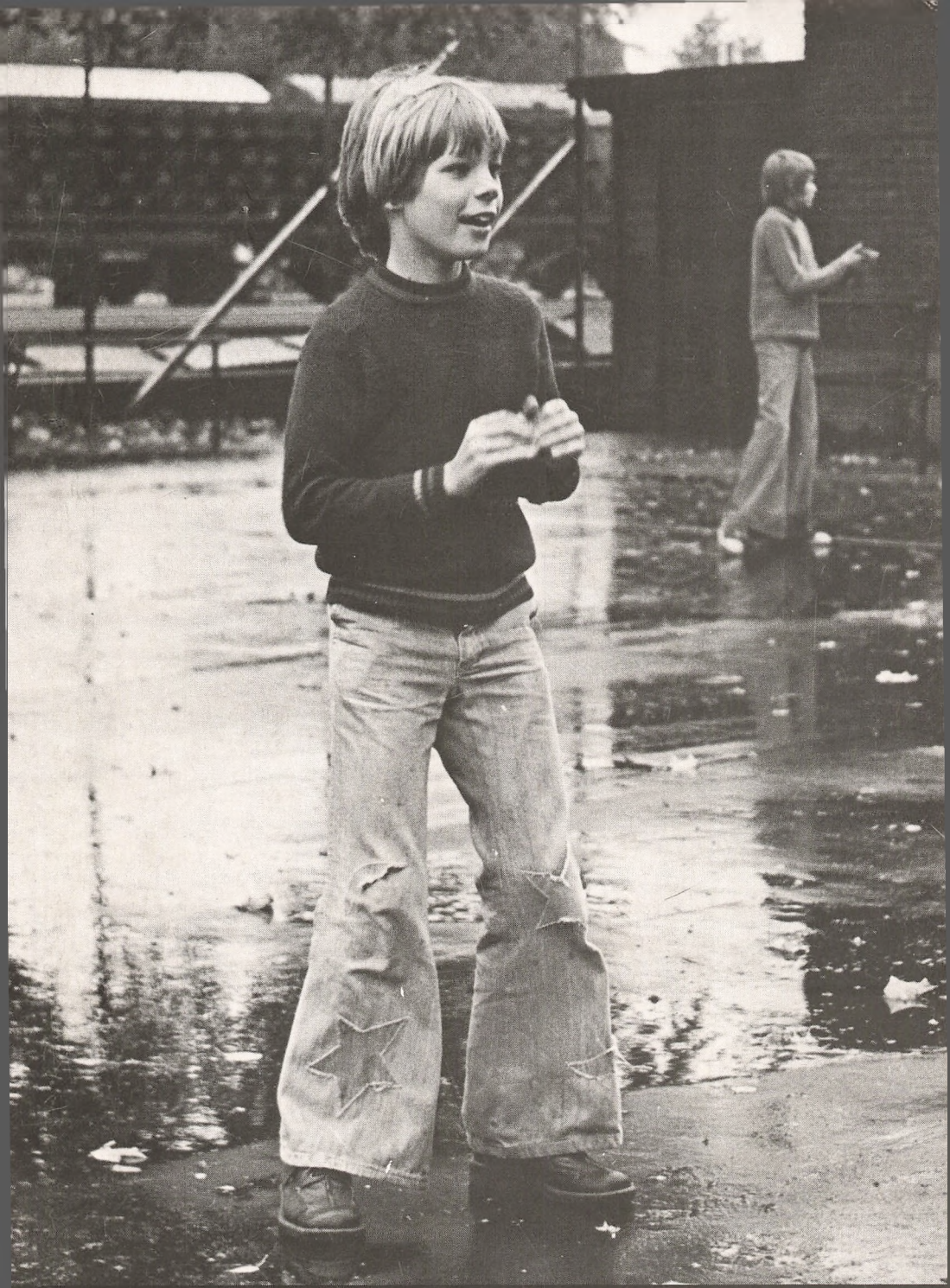
GUNNAR JØRGENSENS SKOLE 1980-81