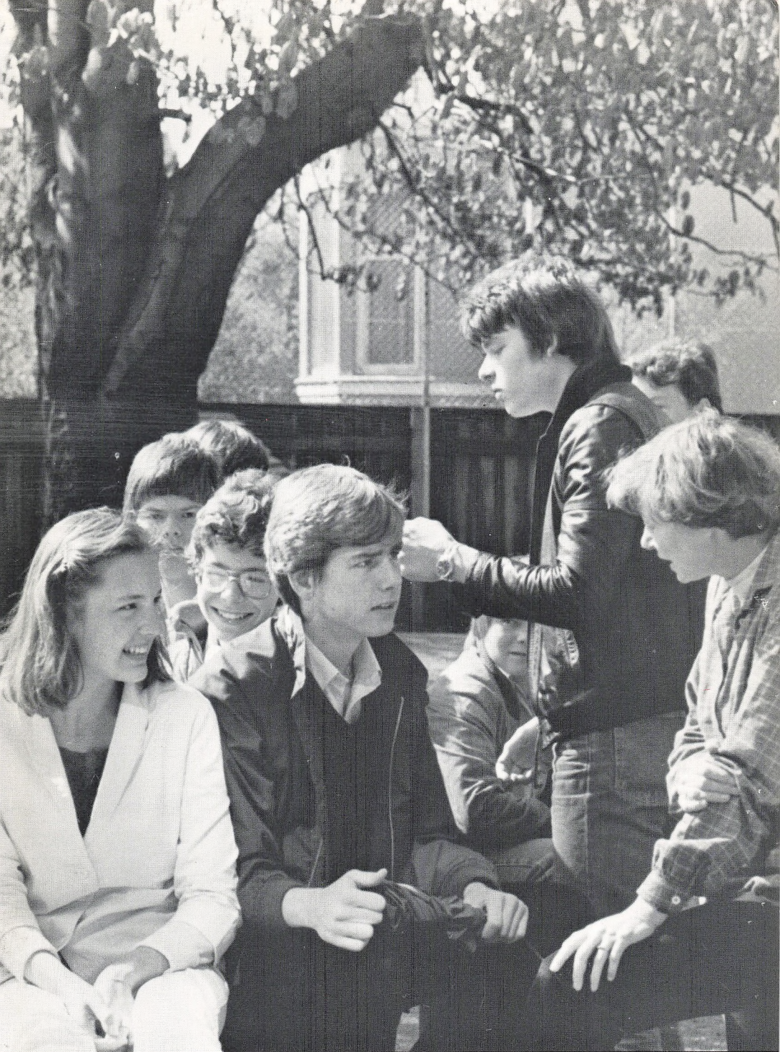
GUNNAR JØRGENSENS SKOLE 1981-82