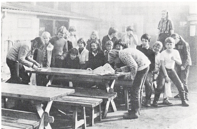
Så er det lige før det store sildeeventyr begynder...

nå først til middagsbordet at falde ned ad trappen og kvæste foden alvorligt. Trods smerter holdt han tappert skansen resten af tiden og humpede med rundt på vore ture.