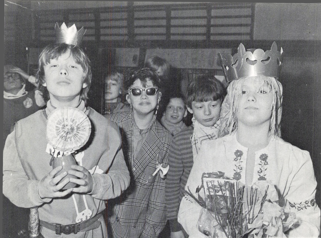
Glade dage på Gersonsvej