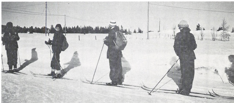
9.y. på vej til fjeldet.