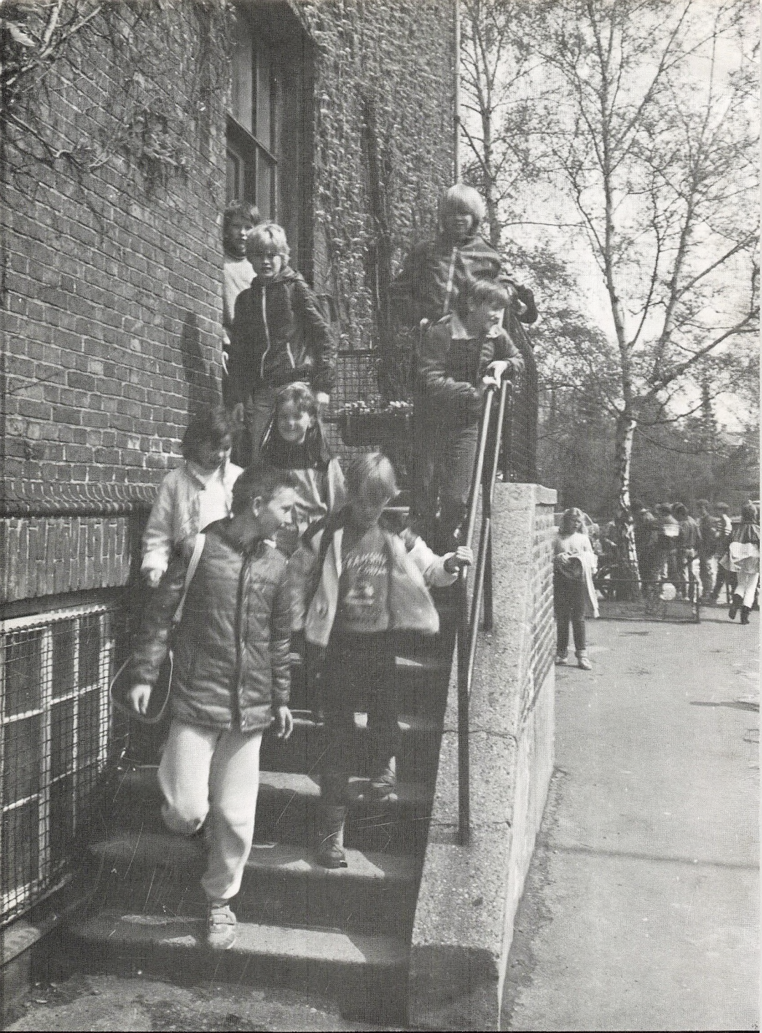
GUNNAR JØRGENSENS SKOLE 1983-84