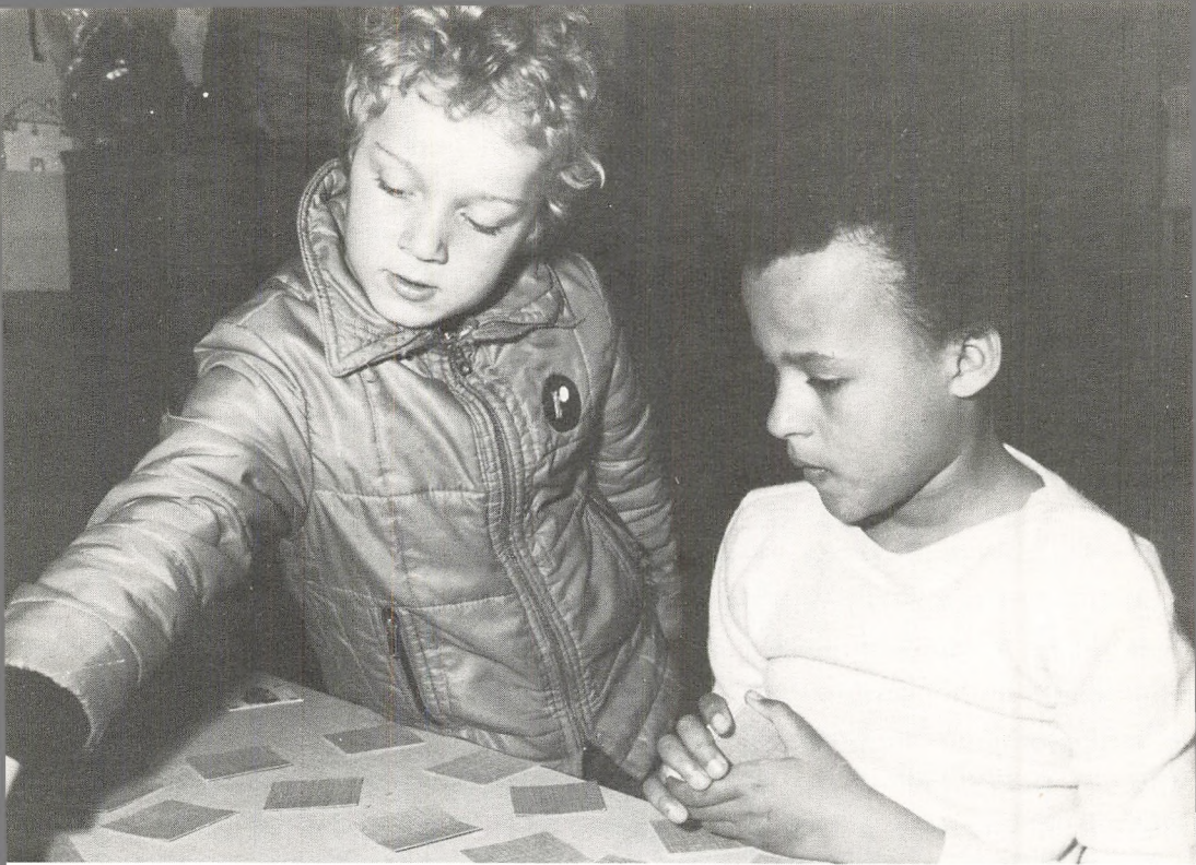
Leg og arbejde