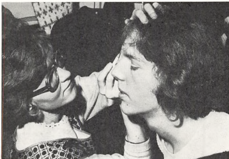
Sminkning til skolekorredien