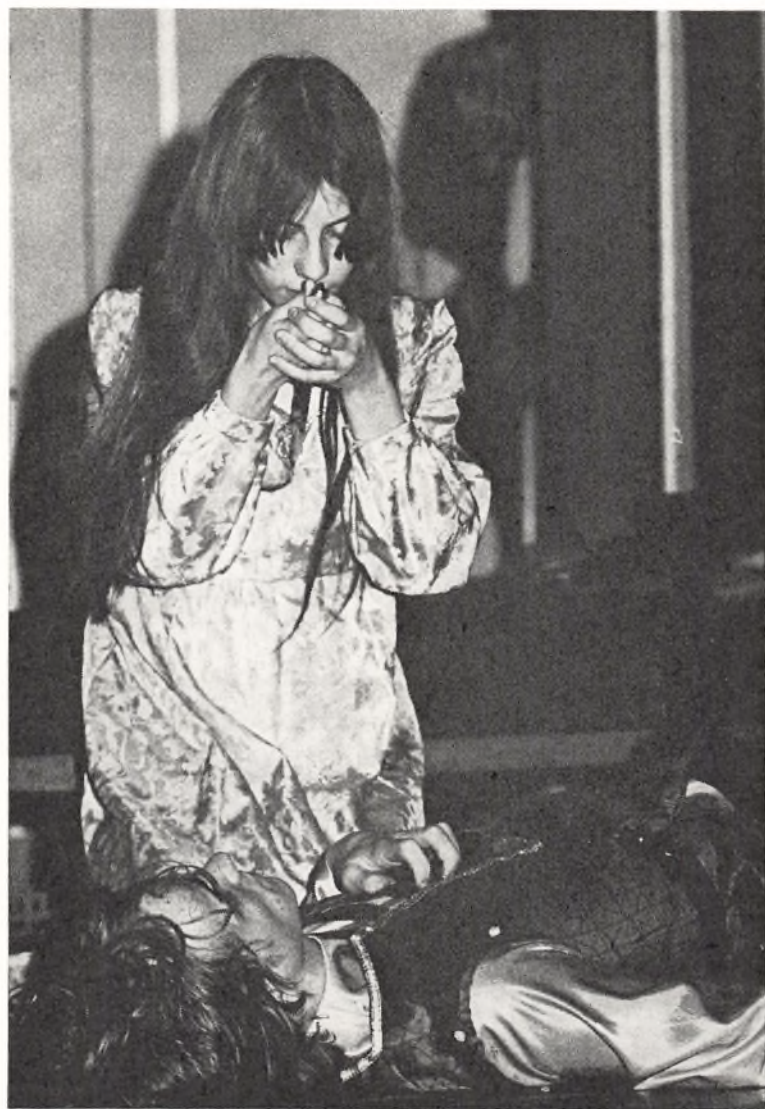
Scene fra skolekomedien