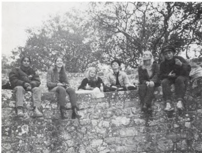
En passende pause

Den dag vi havde planlagt at besøge stedet, strejkede personalet tilfældigvis for første gang i historien. Vi tilbragte en skøn dag med at strejfe rundt i gaderne i den ældgamle by, der omgiver klosteret. Byen har altid været besøgt af tusinder af mennesker bl.a pilgrimme. Dette har sat sit præg på byen, f.eks. findes der en overflod af turistbikse, stoppet med ubrugelige ting til overpriser. Det er altsammen med til at give byen sin helt egen charmerende stemning.