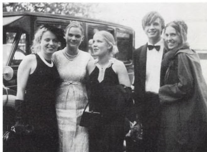
Standsmæssig ankomst til årets store bal.

Middagen var udsøgt, og ligeså var resten af aftenen, hvor man