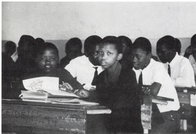
Fra skolebesøg i Sydafrika.

Alt i alt en meget interessant og lærerig udveksling, som på fortræffelig vis var arrangeret af Det Danske Kulturinstitut.