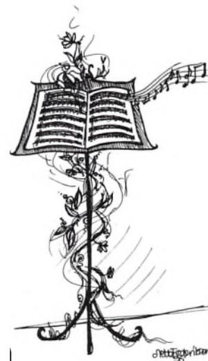
(tegning: Mette Frederiksen, 1y)