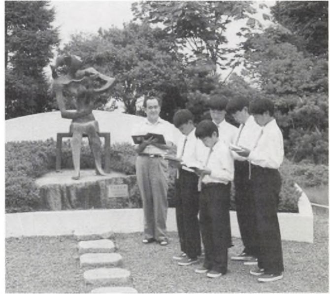
Japanske elever bliver undervist foran Zen-haven. (fra skolens årsskrift)

I Shizuoka præcis midt i Japan ligger en estimeret high school for drenge. Den besøgte jeg i oktober i forbindelse med en rundrejse. Skolen ligger smukt, fra taget var der udsigt til det helleglige bjerg Fusijama og overalt på skolen var der udsigt til myreflittige drenge. 48 elever i en klasse og ikke en lyd; der blev taget noter og lyttet, sjældent talt og aldrig tisket eller småsnakket. Alligevel var drengene gode at tale med på gangene mellem timerne; de syntes faktisk ikke, de var særlig pressede, og da jeg fortalte dem, at vi i Danmark med gru taler om stressede, selvmordsparate japanske skolebørn, var de ved at omkomme af grin. Det havde de i al fald aldrig oplevet eller hørt om! Disciplinen var streng, men kun i timerne. Om eftermiddagen forberedte de årsfest, og der var råben, løben, ophængning af plakater og kunstværker, masser af rå fisk blev bragt til caféen. Pigerne på gymnasiet nede i byen var mere afdæmpede, både i tonefald og fremtidsambitioner. Kvindeundertrykkelsen er massiv, selv de dygtige piger, der uddanner sig på (pige)universiteterne ender oftest som arbejdsløse.