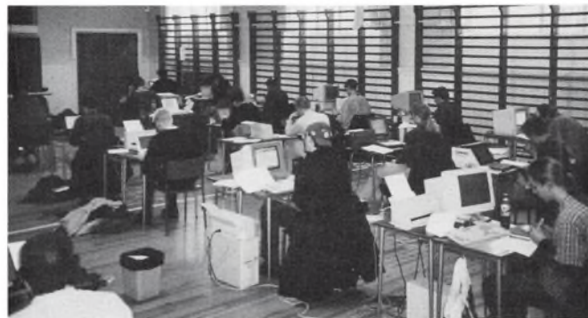
Generalprøve på studentereksamen: terminsprøve på EDB.

I den sammenhæng har vi for første gang haft terminsprøve og skriftlig eksamen med brug af tekstbehandling. 3 g'erne afprøvede det her i marts måned, og det blev en succes. Næsten 50 elever ønskede at bruge det i dansk stil, så det er kommet for at blive. Vort EDB-lokale bruges dagligt, når skriftlige opgaver, dels stilskrivning og dels rapportskrivning, skal laves.