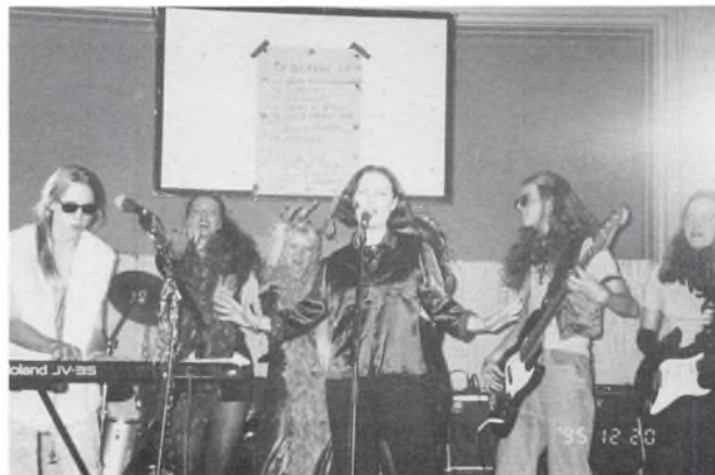
Et musikalsk højdepunkt i bedste danskpopstil.