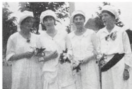
Aurehøjs første studentehold, 1919 (fra Aurehøjs 50 års festskrift)

Tak fordi I har gidet høre på mig og fortsat god fødselsdag.