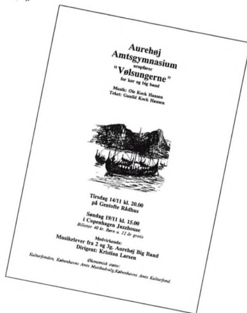
Programmet fra Vølsungekoncerten slog stemningen an.

Der indlemmes nye medlemmer hvert år, og da vi har en mængde afgående 3.g'ere med i udvalget i år, så bliver der naturligvis masser af plads til nye medlemmer næste år.