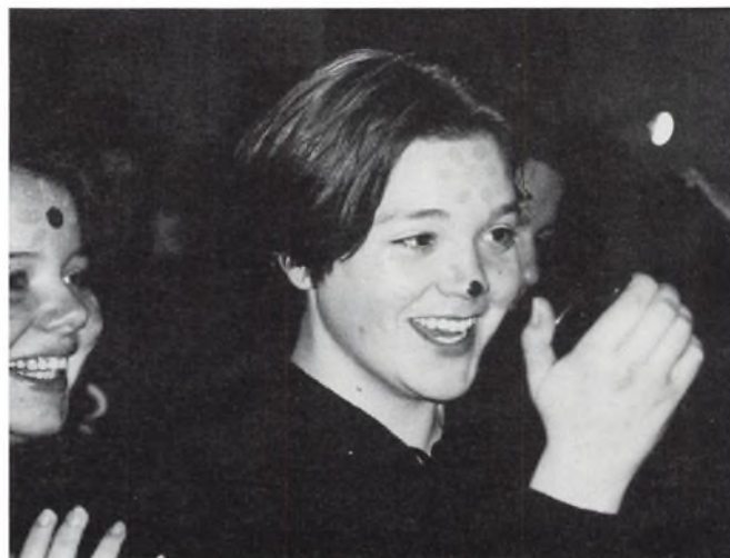
Aurehøj valgte at vise bemalede ansigter.

Falaffel blåbær i hvid tomhed elskende par i solnedgang befri Willy ko pastil grå solnedgang 1/2 måne+ 1/2 måne = fårekilling brandertman “ “ kysvende gladiatorer gammelkommelfinger ups-springer uden krymmel blandet top rus sodavandsis i både åbenlys hvor er toilettet? opturs gumler gigant flue Hvor er den ultraviolette papegøje i min swimmingpool concordpladsen uden G brødrister pizza “dude” køleskab Hvem har spist bananen?