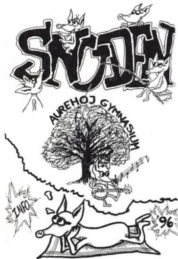
Forsiden af årets info-snude. (tegning: Anne Iz)

Derfor har Snuden gennem det sidste år modtaget flere kubikmeter fanpost, som sjovt nok alle handler om det samme: Hvordan bliver Snuden til?