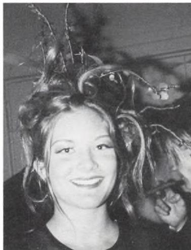
Så flot må man mindst se ud.

Det vrimlede med flotte mænd i deres stiveste puds og yndige møer i betagende aftenkjoler, længselsfuldt spejdende efter endnu en kavalier til balkortet. Gang på gang rullede meterlange limousiner ned ad indkørslen med feststemte 3g-piger med et glas champagne i den ene hånd og en langstillet rød rose i