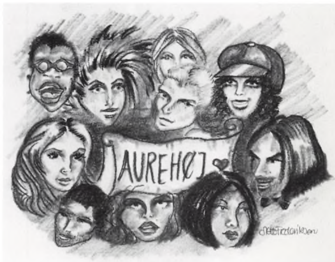
Typiske Aurehøjelever. Grafik til Aurehøjs homepage. (tegning: Mette Frederiksen, 1y)

nettet bliver en integreret del af vores hverdag. Projektet fortsætter til næste år, hvor vi vil forsøge at få etableret kontakt til ligeindede klasser i engelsk- og tysktalende dele af verden.