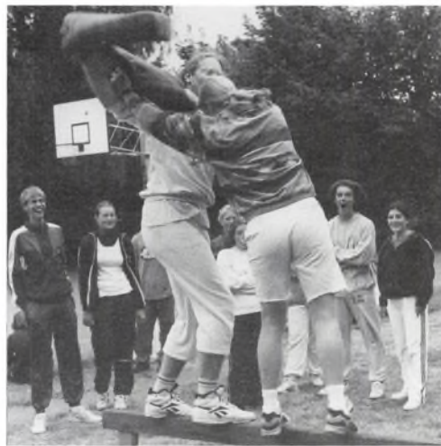
Konkurrencen var hård til årets idrætsdag.

Interessen for den frivillige idræt er heldigvis stor, de 2 ugentlige idrætstimer kan slet ikke dække behovet. Så allerede nu er det besluttet, at i skoleåret 96/97 bliver der tilbudt frivillig idræt i fodbold, volley, basket og aerobic.