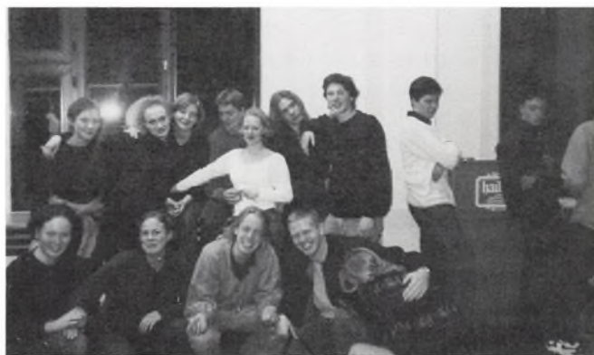
Aurehøjs delegation til ungdomsparlamentet

(milkøkomité, udenrigskomité, socialkomité o.s.v.) indledte møderækken. Ud fra en given politisk problemstilling udarbejdede hver komité et handlingsforslag, som fremlagdes i Parlamentet, debatteredes og sattes til afstemning. Bliver et forslag vedtaget, sendes det til Europa-Parlamentet. Man skal dog næppe nære større forhåbninger om, at vedtagne forslag kommer til at præge europæisk politik væsentligt eller overhovedet.