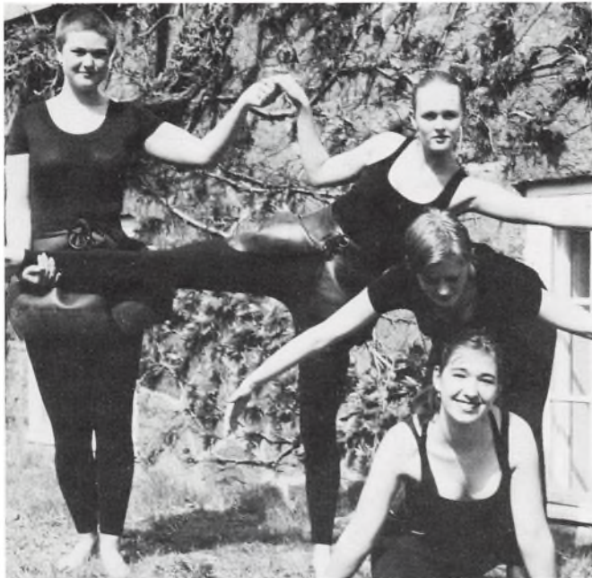
Aurehøjs deltagere i balletprojektet, Water Prayers .

portører, iført kitler og øvrigt grej, og var absolut behjælpelige med at føre publikum ind i livet og byens rum! Det var en kold og snefugtig dag, men vi gennemførte modigt og meget professionelt, på trods af de ugunstige vejrforhold - forestillingen foregik udendørs!