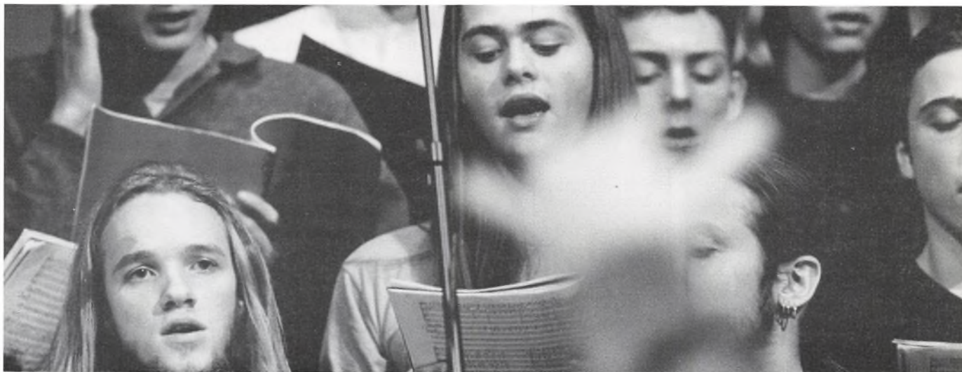
Fra opførelsen af Vølsungerne på Gentofte rådhus.

I starten gik koret lidt trægt for det var hårdt, og flere og flere faldt for den store fristelse det var at blive væk. Vi havde ikke tid nok, og kun bladsangerne kunne deres stemmer. Samtidigt vidste vi, at bigbandet slet ikke var begyndt at øve endnu.