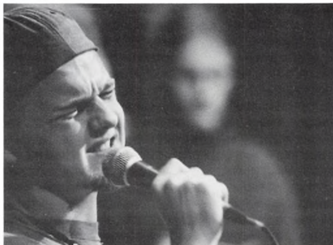
Fra opførelsen af Vølsungerne på Gentofte rådhus.

I april måned deltog hele skolen i det stort anlagte Kulturby 96-projekt "Gymnasiet og HF viser ansigt", og til overflod fik vi besøg af et canadisk skoleorkester samtidig. Og så var der årsfesten, hvor orkesteret spillede op til wienervals og big bandet til en "Swing-om" i lille sal, foruden alle koncerterne og caféerne (de fleste begivenheder er omtalt nærmere på de næste sider).