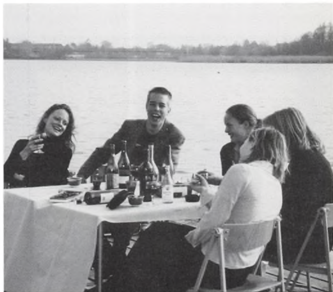
Fra forestillingen, "En finger med i spillet".

Fem mennesker overbevises efterhånden om rigtigheden i Sokrates filosofiske prædiken, og giver hver især deres personlige hyldest til - og accept af - den sande Eros, som kærlighedens ultimative mål.