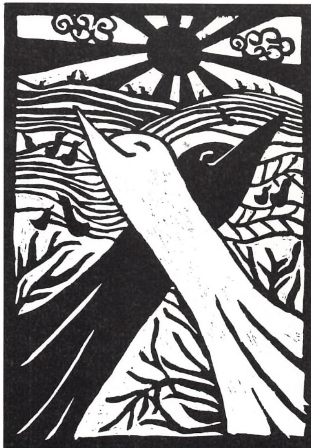
Tryk af Laura Albeck

Projektet tiltrak mange mennesker, og selvfølgelig mange Aurehøjmennesker. Det repræsenterede på flere planer en tankegang og en realiseringsform, vi har det godt med. Man tager de bekendte livsvilkår: Vi er her, vi har netop alderen til et eller andet - f.eks. til at gå i gymnasiet, til at være forældre til gymnasieungdom - eller måske til snart at skulle på alderdomshjem. Vi er født ind i rammer af en vis tryghed, en selvforståelse står altid parat og byder sig til, en vis træt forhåndsviden om de livsscenerier, vi kan imødesee, ligger klar til os. Vi, det flossede velfærdssamfunds menneskemodeller, som i vores eget liv både er tilskuere og deltagere. Men når der så får lov at gå teater i det, løftes hverdag og vaner ud af bindingerne og fremstår - opløftet og opløftende - lige til at få bedre øje på, til at gå ind i og til at gennemskue med større humor, gustenhed eller livsvilje.