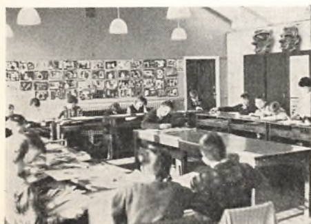
Der arbejdes på tegnesalen.