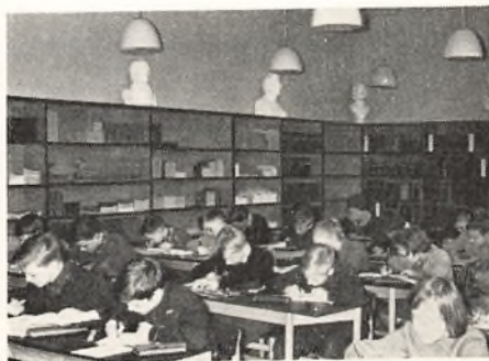
Vor nye læsestue.

Foruden læsestuen har skolen et udlånsbibliotek, der søges flittigt efter skoletid, inden børnene går hjem. I løbet af de sidste år er bestanden af fagbøger, som særlig egner sig for børn, blevet stærkt øget, og interessen for disse bøger er hos børnene steget i takt med bogbestandens vækst. – De små klasser har alle i deres eget klas-