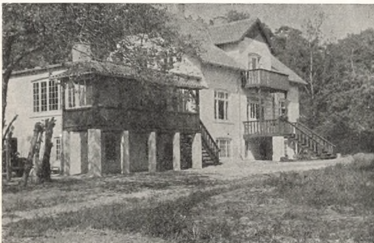
Lejrskolen i Saunte ved Hornbæk.

En del af skolens forældre er medlemmer af Lejrskoleforeningen. Vi takker for den støtte, der herved ydes os. Indmeldelser kan ske på skolens kontor. Det årlige kontingent er fastsat til mindst 2 kroner.