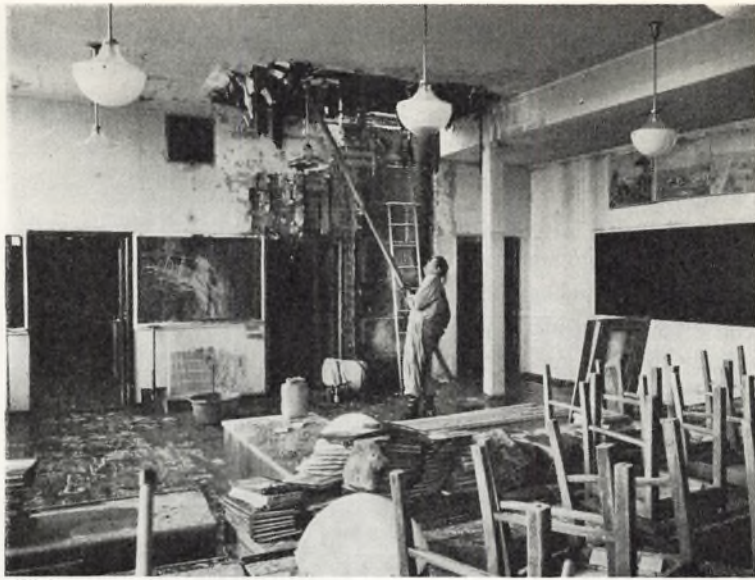
Den udbrændte geografisal