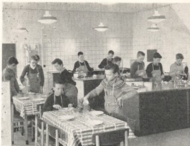
„Der er serveret“.

I det forløbne skoleår har skolen endelig kunnet tage de dejlige nye husgerningslokaler i brug.