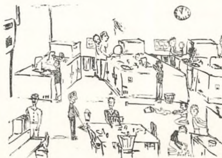
Her går det godt.