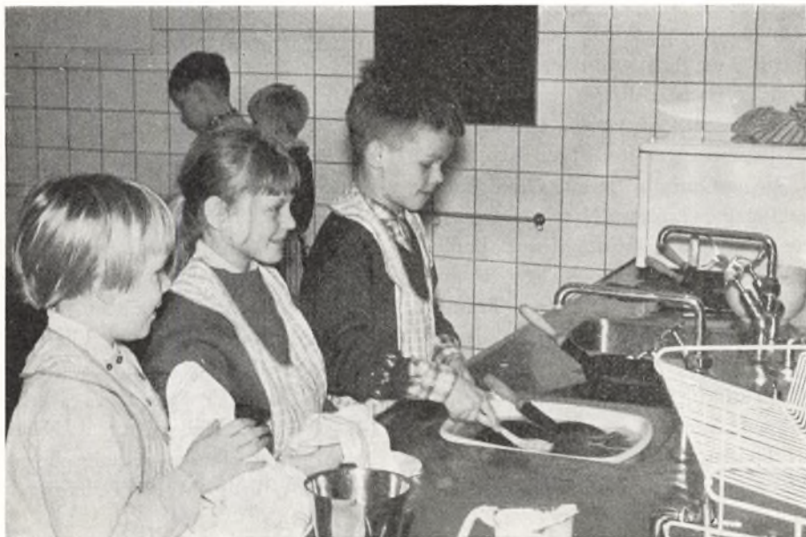
3 v forsøger sig i skolekøkkenet.

De nye 1. klasser skal dog først møde mandag den 21. august kl. 9 i skolens mødesal.