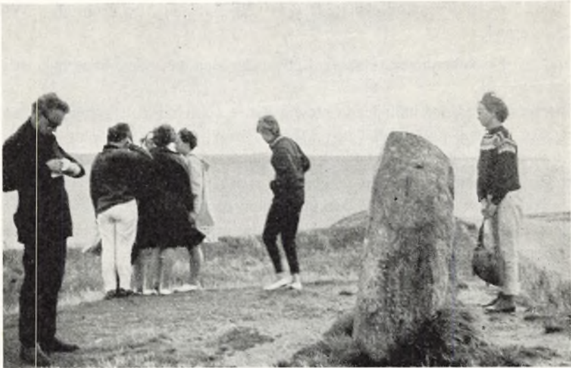
På lejrskole. (Ryes Skanse)