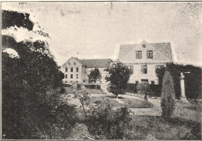
REALSKOLEN og SEMINARIEBYGNINGEN set fra Skolehaven.