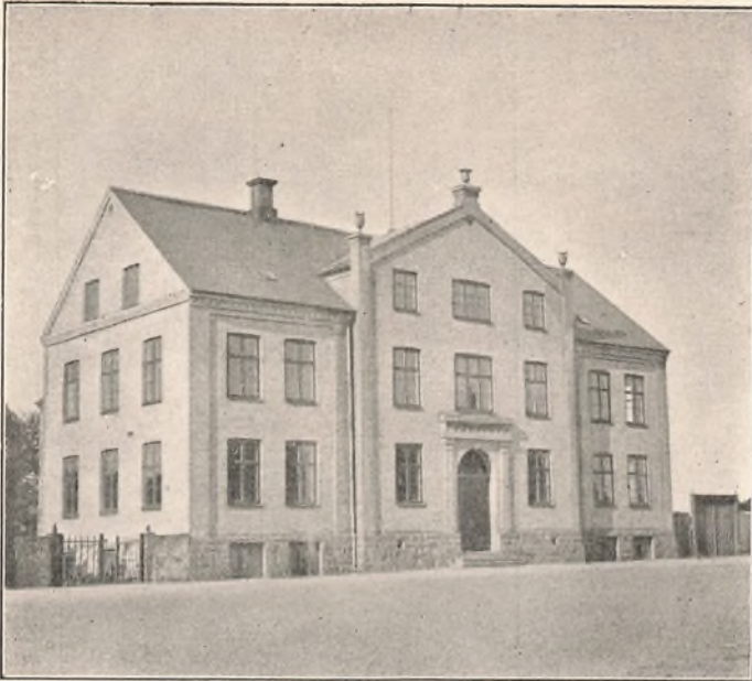
NEXØ REALSKOLE TEKNISK SKOLE