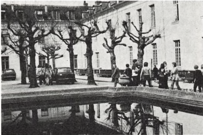
2a på Centre International d'Etudes Pédagogiques, Sèvres.

24.–26. februar: Skolekomedie. — Elever fra 2g opførte