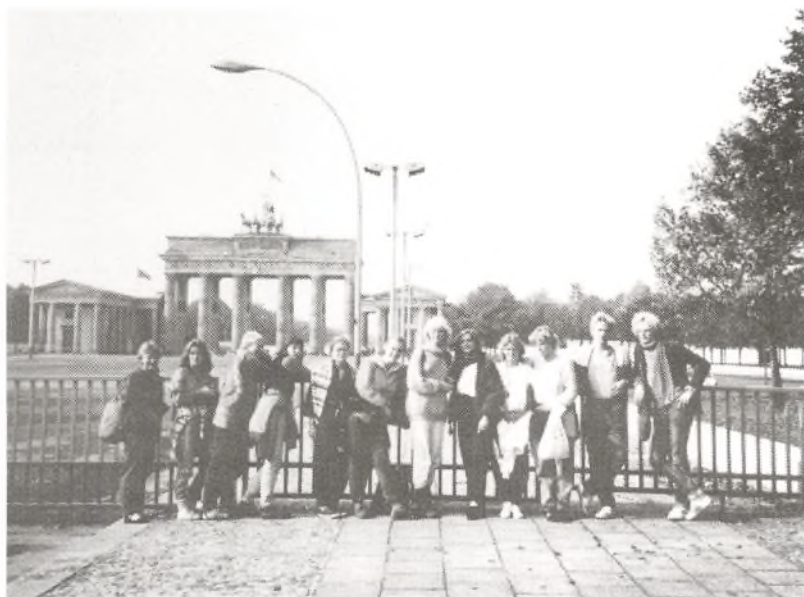
3g ved Brandenburger Tor i Berlin