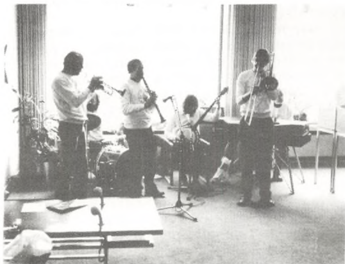
Biskop Byges Band spiller i Sparekassen