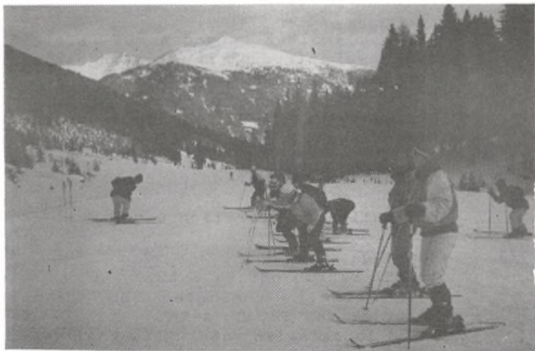
Skiskole i Østrig

Flytning, ændring af telefonnummer eller af faderens/moderensstilling, navneforandring o.l. skal snarest meddeles kontoret.