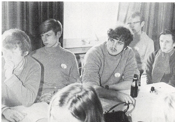
Tidens problemer overvejes på Sonnenberg