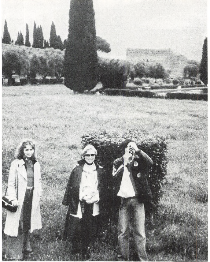
Fra den evige stad