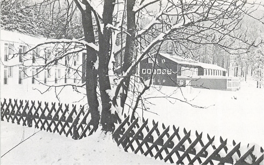
Sonnenberg i Oberharz