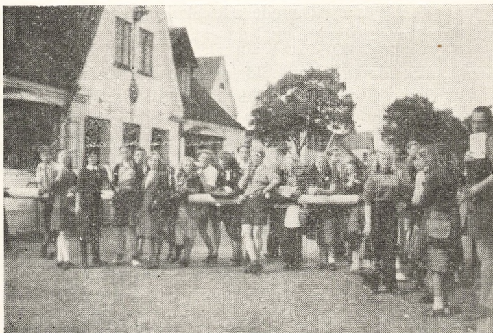
Elever ved Krusaa-Grænsen.

I Dagene fra 24.—30. September 1946 gennemførtes en Lejrskole med Eleverne fra samtlige Gymnasieklasser. Turen gik til Kollund Grænsehjem ved Flensborg Fjord, og Prisen var kun 30 Kr. pr. Elev, idet Kommunen alholdt yderligere Udgifter. Selve Rejsen foregik med Statsbanerne, men næsten alle Ekskursionerne gennemførtes paa Cykle.