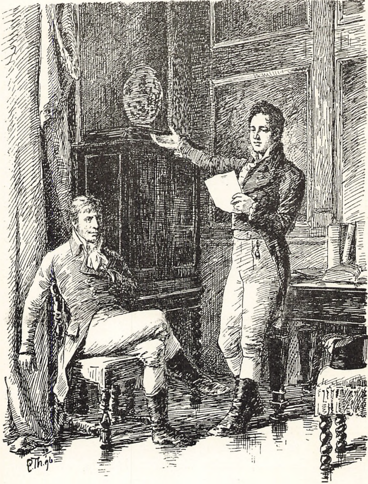
Oehlenschläger læser »Guldhornene« højt for Henrik Steffens.