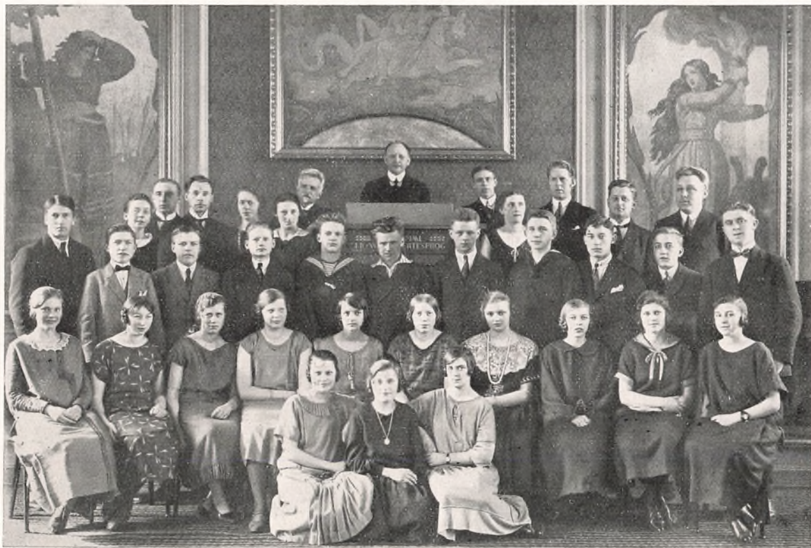
Afgangsklassen og deres Lærere. Marts 1925.