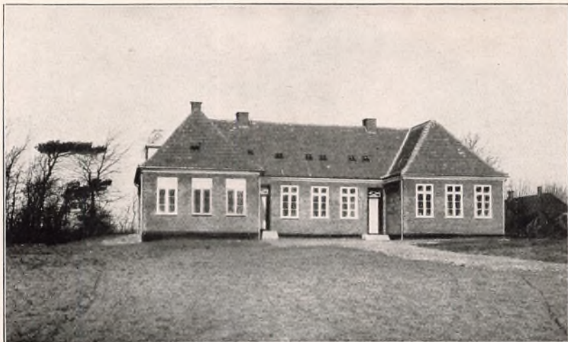
DEN DANSKE SKOLE I JARUPLUND.