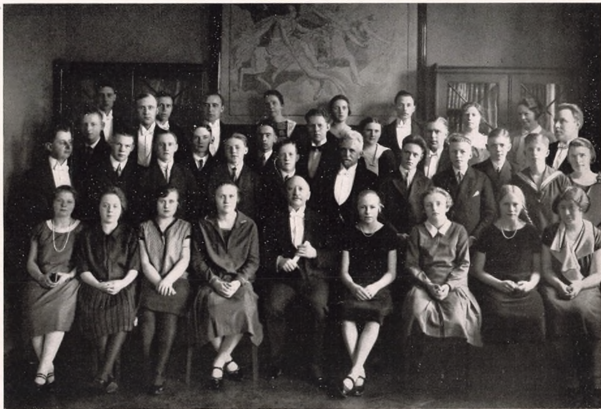
AFGANGSKLASSEN OG DENS LÆRERE. MARTS 1927.