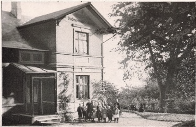
KOBBERMØLLESKOLEN. DEN SØNDERJYDSKE DAGS SKOLE.