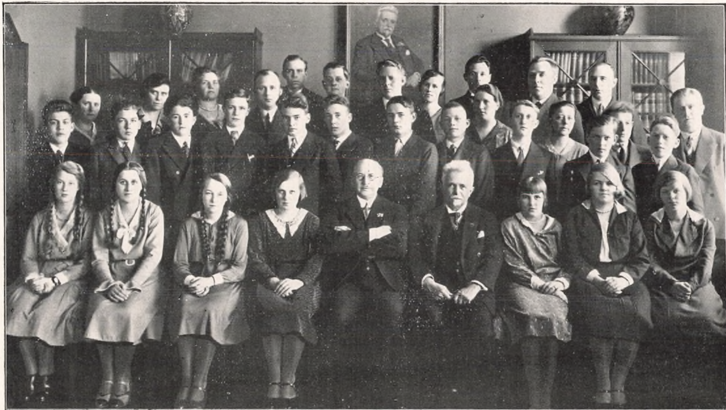
AFGANGSKLASSEN OG DENS LÆRERE.