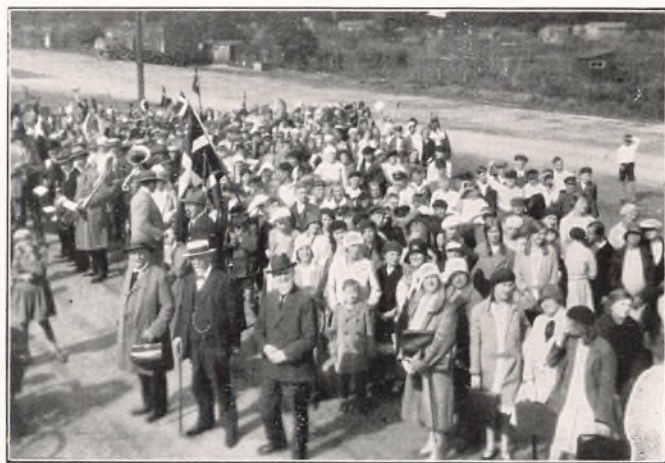
Duborgskolen i Vejle.