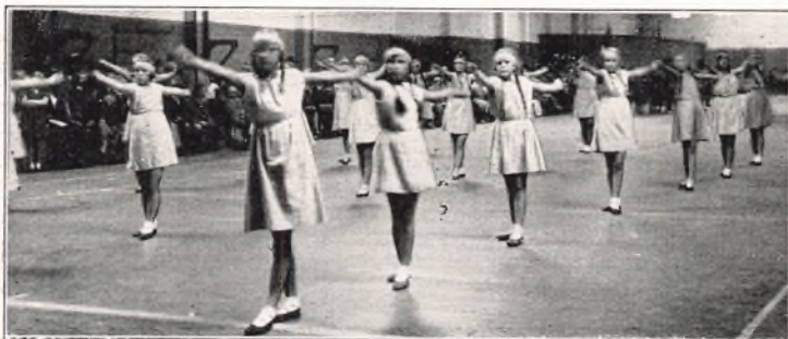
Pigegymnastik ved Idrætsstævnet.

Skolens frivillige Sport og Idræt har i Sommerhalvaaret 1930 haft 125 Deltagere blandt Skolens Elever. Undervisningen har ligget uden for Skoletiden, og der er blevet undervist i Boldspil, Idræt, Roning og Svømning. 21 Elever har aflagt Frisvømmerprøven efter de ved Byens Skoler gældende Regler.