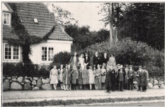
Afgangsklassen ved Kongens Lyngby.

Den sidste Dag anvendtes til en Tur til Lyngby og et Besøg paa Landbrugs- og Folke-musæet der.