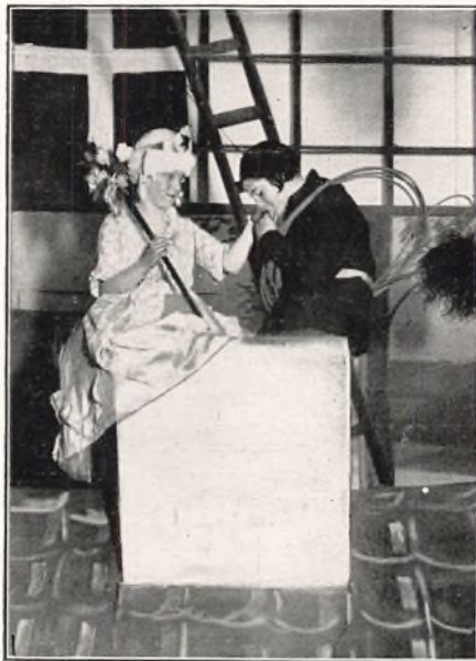
Hyrdinden og Skorstensfejeren.