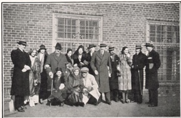
SKUESPILLERE FRA DET KGL. TEATER BESØGER DUBORGSKOLEN.