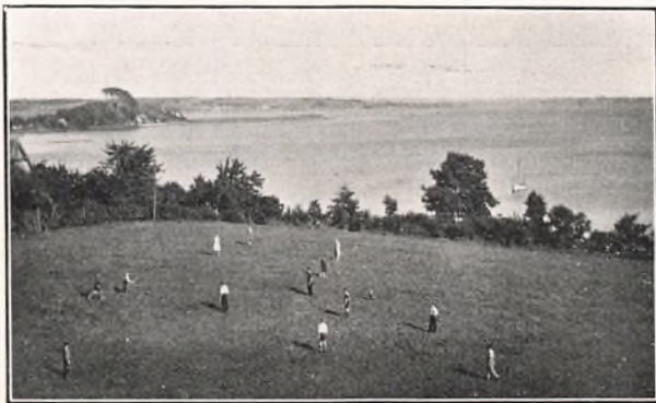
FRA LEJRSKOLEN VED RØNSHOVED.

Ved Undersøgelsen i November 1931 af 65 Elever fandtes 30 med sunde Tænder, medens de øvrige havde ialt 102 syge Tænder.