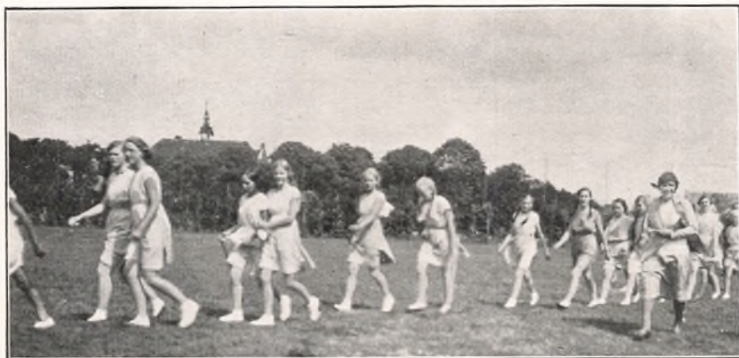
FRA IDRÆTSSTÆVNET. 28. JUNI 1931.

Den her nævnte Sølvp­lade med Frølichs Tegning er gengivet i Duborgskolens Aars­beretning for 1927—1928.