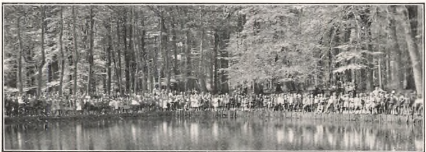
SKOLEN I MARIESKOVEN. MAJ 1931.