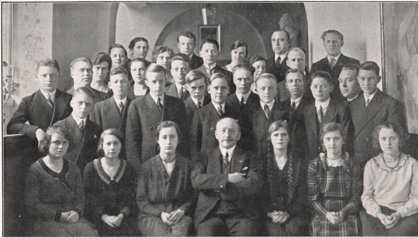
AF'GANGSKLASSEN OG DENS LÆRERE. MARTS 1932.