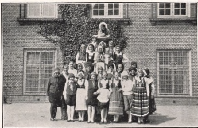
FOLKEDANSERE FRA REAL- OG F-KLASSENE. Juni 1931.