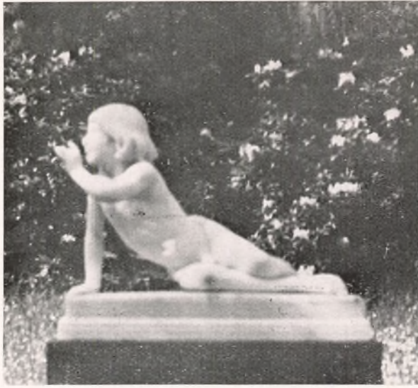
FRA FLENSBORG PARK.