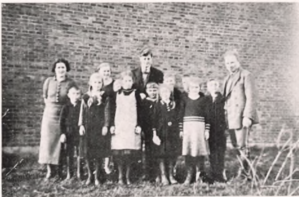
SKOLEN I LADELUND.