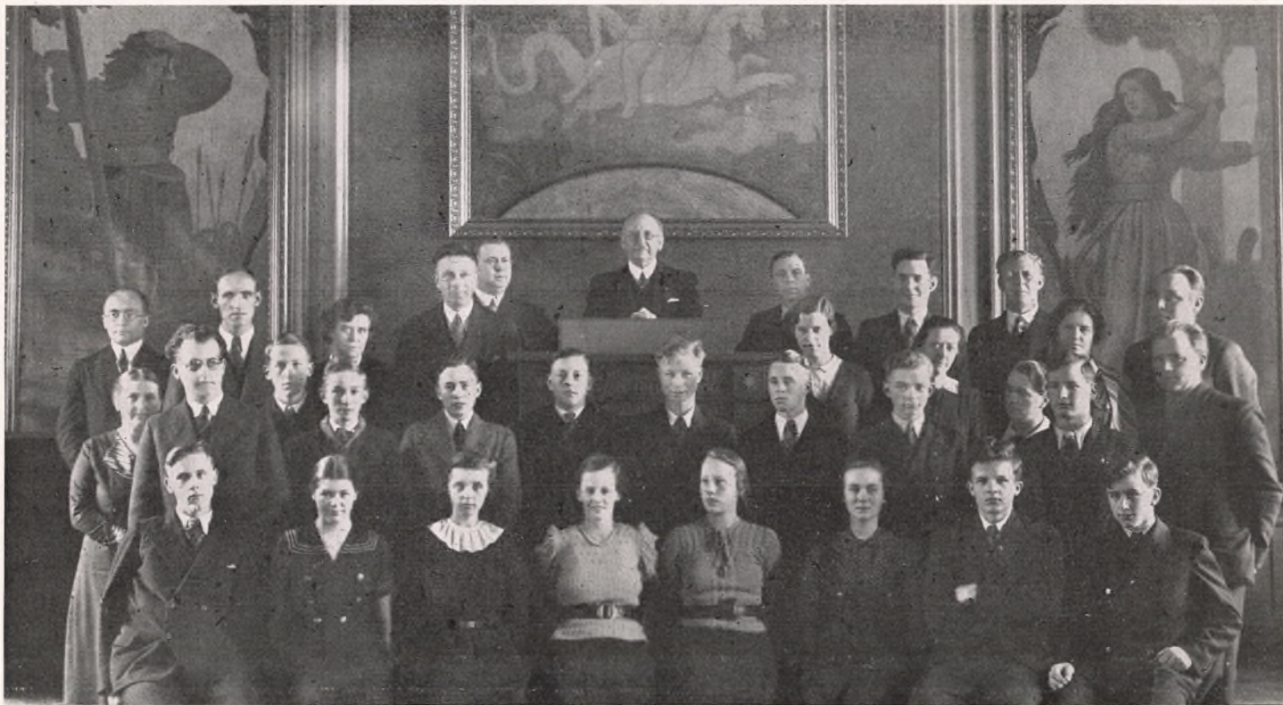
AFGANGSKLASSEN OG DENS LÆRERE. MARTS 1937.