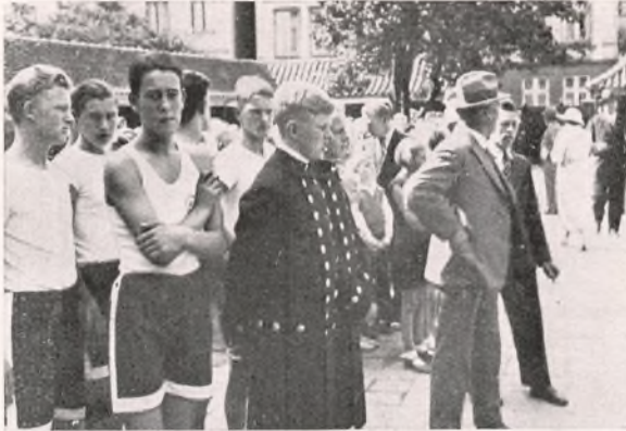
»MULERNE« FRA ODENSE BESØGER DUBORGSKOLEN.