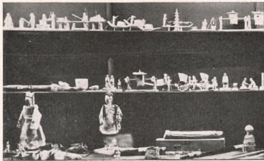
FRA DUBORGSKOLENS ANTROPOLOGISKE SAMLING.