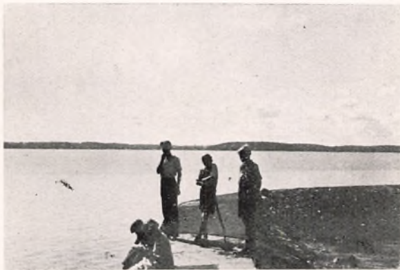
LEJRSKOLEN. VED FLENSBORG FJORD.