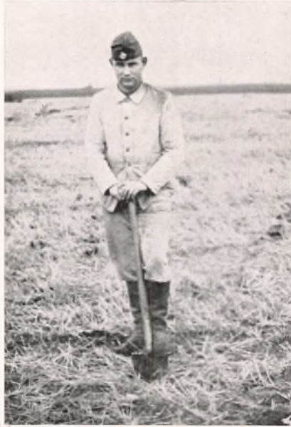
I TYSK ARBEJDSTJENESTE.

ikke gjaldt vor Ungdom, samt bad om, at dette maatte blive fastslaet. Henvendelsen var underskrevet af Formændene for Den slesvigske Forening, Danske unges Fællesfront og Dansk Skoleforening. Et foreløbigt Svar indløb den 23. December. Men da der fra de tyske Ungdomsførere udsendtes Ordre til Mønstring af alle unge, blev Spørgsmaalet brændende, og der rettedes nye Henvendelser den 2. og 10. Februar 1937. Endelig den 17. Februar forelaa følgende Afgørelse: »Durch Telegramm der Jugendführung des Deutschen Reiches wird mitgeteilt, dass die Jungen und Mädchen dänischer Volksangehörigkeit bis auf weitere Weisungen der Jugendführung des Deutschen Reiches zurückgestellt werden.«