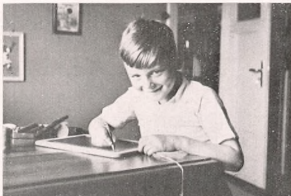
DEN VANSKELIGE SKRIVEKUNST.

Elevtallet ved Duborgskolen maa nu ses i Relation til Elevtallet ved Den danske Kommuneskole.