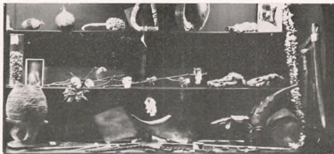
FRA DEN ANTROPOLOGISKE SAMLING.