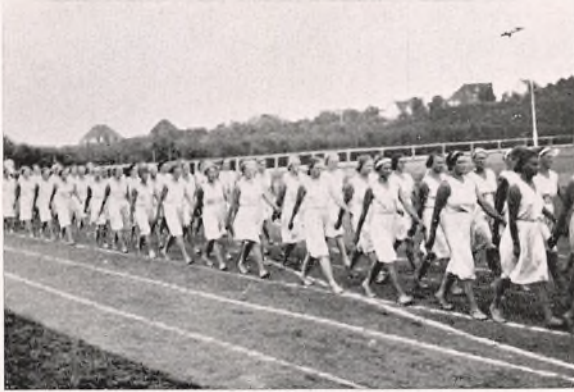
NIELS BUKHS GYMNASTER PAA FLENSBORG STADION.

Udgiften, der har været forbundne med Foredrag, Koncerter m. m. bæres af Grænseforeningen.