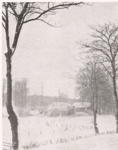
VED KOBBER- MØLLEN.

Valdemarsdagen, 15. Juni. Skolens Flag var med ved Morgensangen. Rektoren talte om Dannebrog og dets Betydning for det danske Folk. Til Slut sang vi »Vift stolt paa Kodans Bølge«.