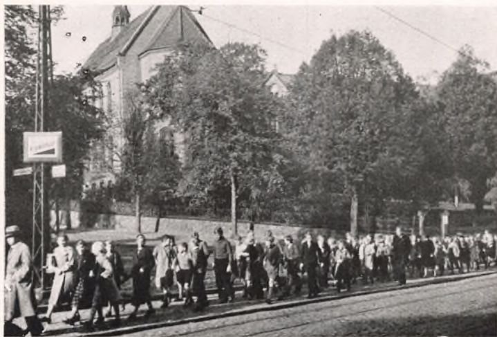
UNDERVEJS FRA SKOLE TIL KIRKE.