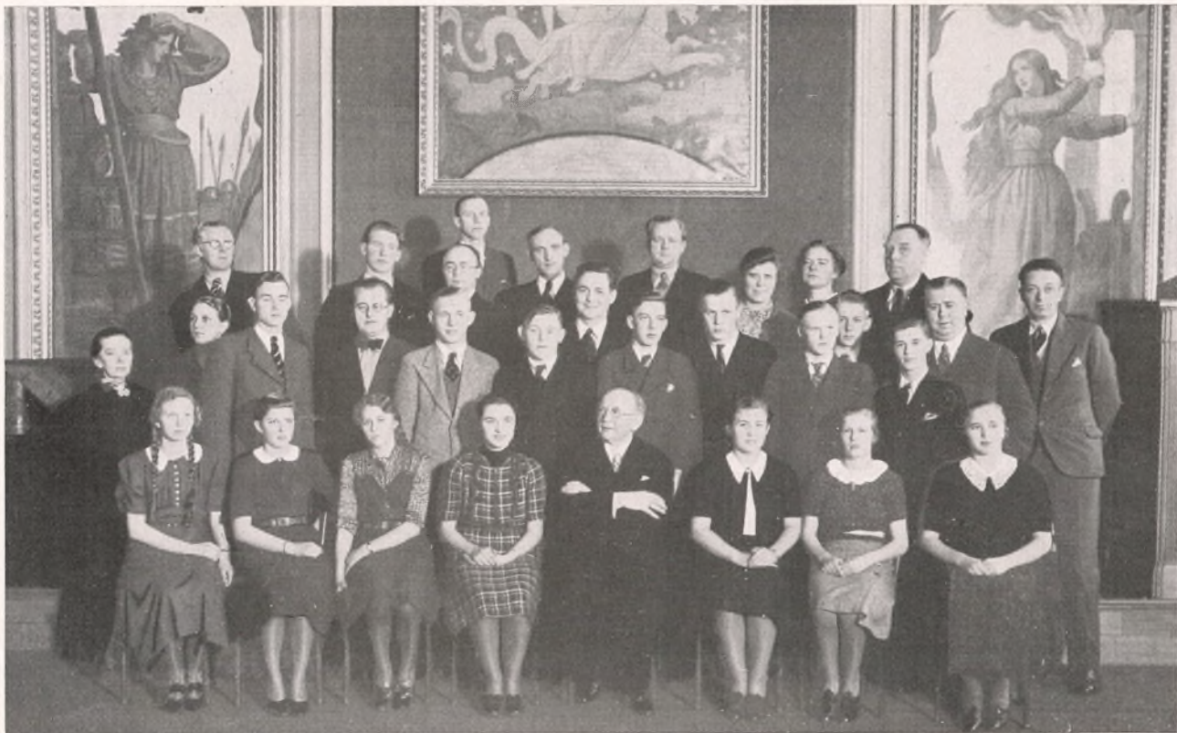
AFGANGLASSEN OG DENS LÆRERE. MARTS 1939.