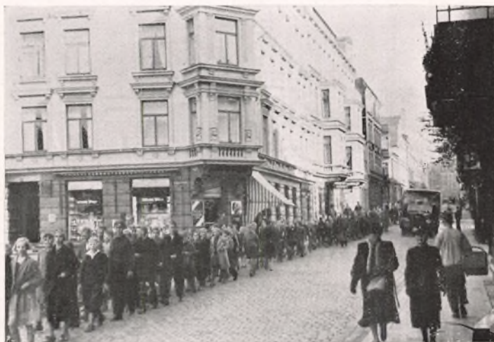
GENNEM FLENSBORGS CADER.