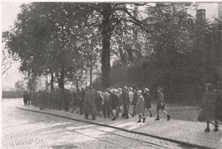
VED BELLEVUE I FLENSBORG.

Ved Undersøgelsen i November 1938 blev 102 Elever undersøgt. 48 Elever havde sunde Tænder, medens der hos de andre Elever fandtes 114 syge Tænder.