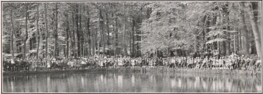
VORE ELEVER VED SVANEDAMMEN.

Aftenen fortsattes i Gymnastiksalen, hvor de unge fik sig en munter Svingom. Festen her sluttede som altid ved slige Lejligheder med Fællessangen »Altid frejdig, naar du gaar«, mens Rektor bød Farvel og Paa Gensyn!