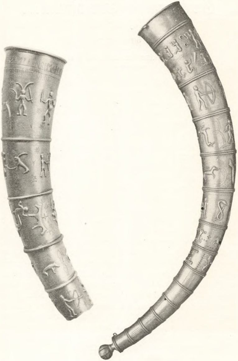
Guldhornene fra Gallehuus.