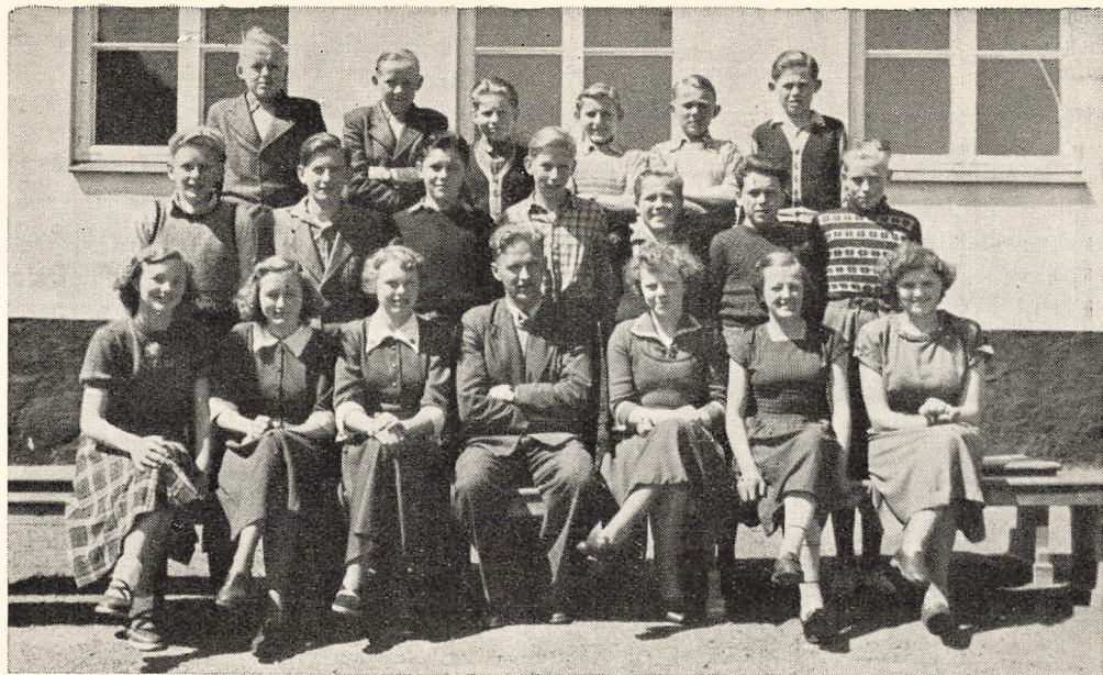
7. klasse 1952