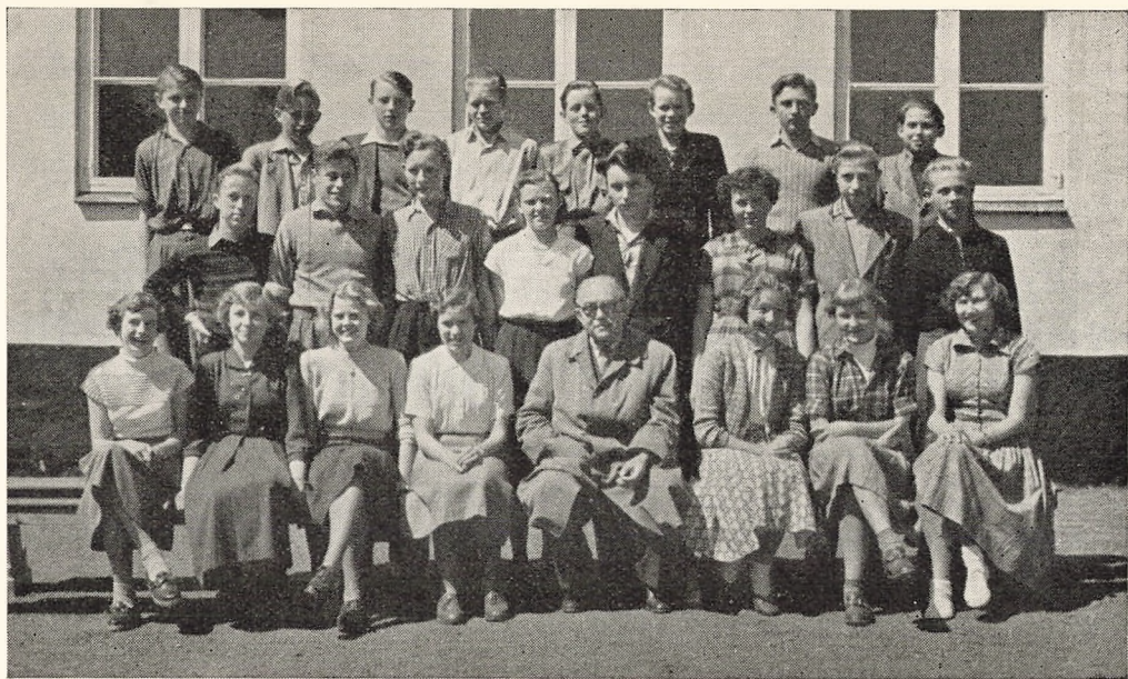
IV mellemskoleklasse 1952