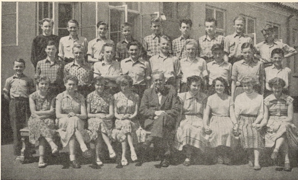
IV mellemskoleklasse 1953